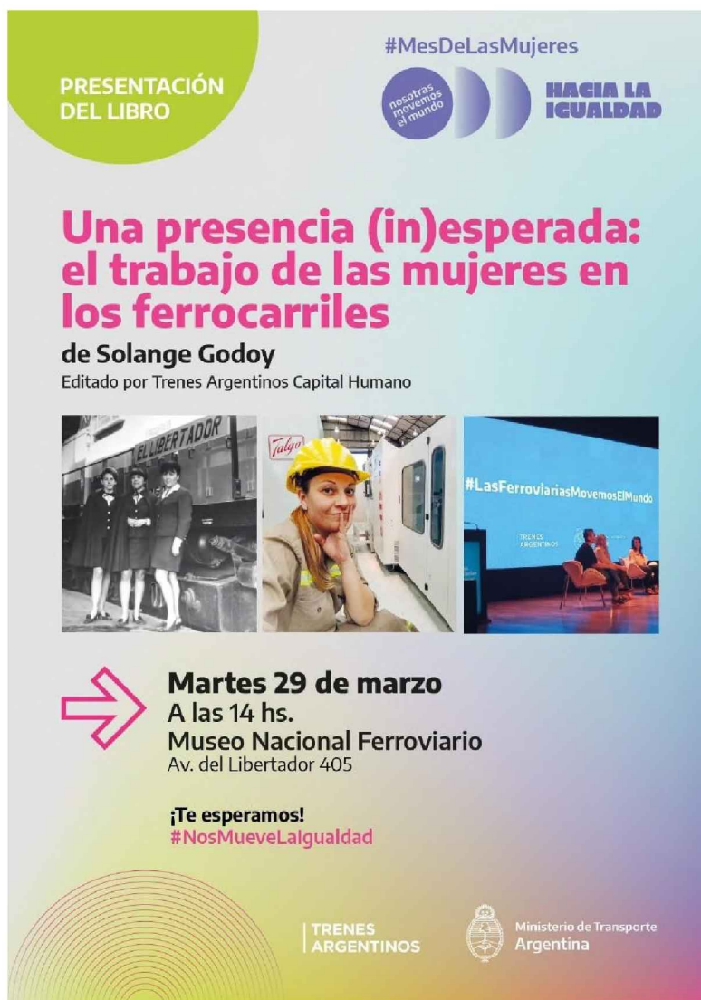
FIGURA 3 Volante digital de la presentación del libro, 2022

Es importante destacar que la publicación tuvo ejemplares en papel y en formato digital. Este último formato facilitó su circulación por medio de diferentes redes sociales digitales. Sobre la base de las imágenes incluidas en el libro, se realizó una muestra fotográfica itinerante que recorrió el Predio Ferial de Tecnópolis, las estaciones terminales de Retiro y Constitución, y el Museo Nacional Ferroviario, pudiendo ser una oportunidad para que una masiva cantidad de personas acceda a ella.