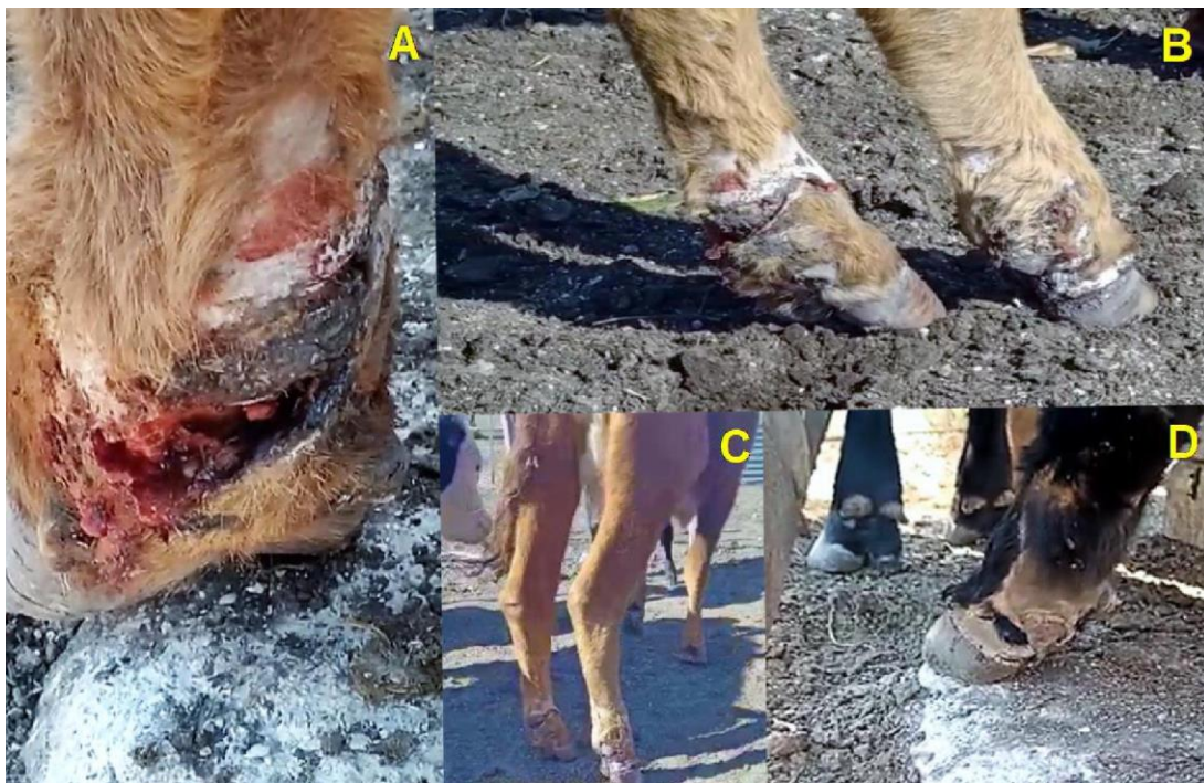
Figura 1. Lesiones podales en bovinos afectados por el consumo de festuca con infestación endófito por Epichloë coenophiala . A) Lesión necrótica profunda, extensa, que involucra la región distal del metatarso, la región compedal (cuartilla) y la región coronal plantar. B) Línea necrótica (gangrena seca), con esfacelo, escaras y tejido de granulación circuncribiendo la región compedal (cuartilla) del miembro pelviano izquierdo. C) Proceso cicatrizal sobre las extensas áreas de necrosis que involucran de forma bilateral la porción distal de los miembros pelvianos. D) Lesiones alopécicas en proceso de curación, con formación de cicatriz y reepitelización.

El porcentaje de infestación de la pastura se determinó mediante muestreo en zigzag (Petigrosso et al. , 2019), recolectándose un total de 160 macollos de festuca en 40 puntos de las banquinas en pastoreo. Se constató la presencia de Ec en un 70 % de los macollos, utilizando la tinción de azul de anilina y observación microscópica (Figura 2).