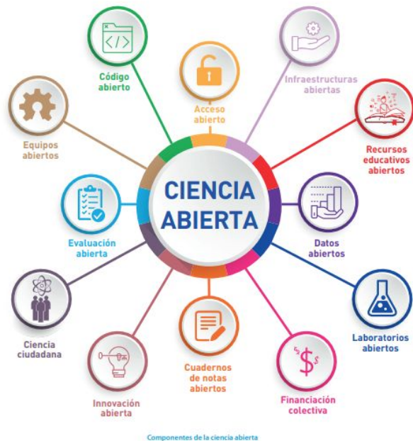
Ilustración 1. Procesos en los que se estructura la actividad científica