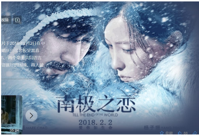
3. Imagen de promoción de la película “Hasta el fin del Mundo” 2018.