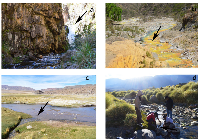
Figura 3. Hábitat de Oncorhynchus mykiss , La Rioja, Departamento Chilecito: a-arroyo Pismanta, b- arroyo Agua Negra; Catamarca, Departamento Belén: c-La Angostura, d-El Angosto, Taller Proyecto Ciudadano.