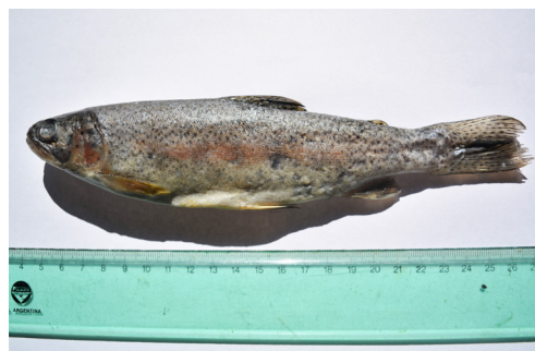
Figura 2. Oncorhynchus mykiss : Provincia Catamarca: El Angosto, Laguna Blanca.

(Figura 3c) y El Angosto (Figura 3d). En ambos casos la barrera para su dispersión aguas arriba y abajo la constituye el escaso caudal que lo