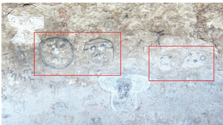
Figura 5. Representaciones de rostros/mascariformes pictograbados de HH

También se han identificado un grupo de motivos que comprenden la representación de dos pares de rostros/mascariformes pictograbados que, por el momento, preferimos asociar a este lapso a partir de argumentos de base comparativa: primero, que la representación de rostros humanos o mascariformes conforma uno de los temas rupestres característicos del Formativo del NOA (Aschero, 1996, 1999, Martel, 2004) y, segundo, que la ocurrencia de a pares ha sido registrada también en la quebrada de Miriguaca, en ANS (Martel y Escola, 2011), lo cual establece otro nuevo posible vínculo entre las poblaciones a uno y otro lado del área internodal del volcán Galán (figura 5).