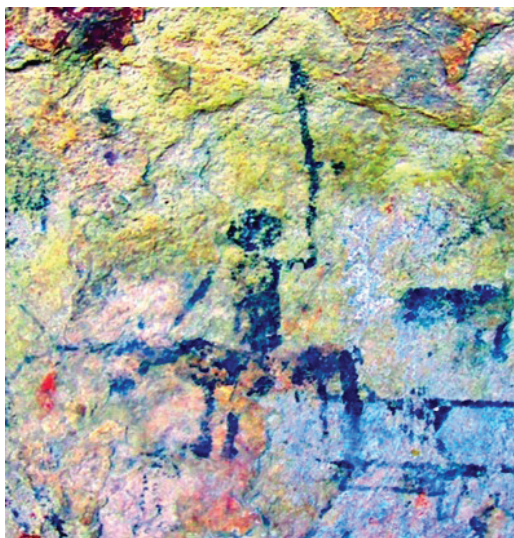
Figura 12. Motivo de jinete con lanza; imagen tratada digitalmente con D-Stretch