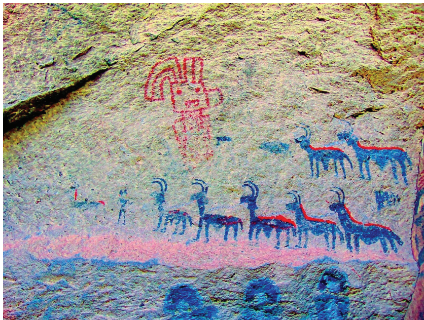
Figura 7. Figura antropomorfa con rasgos felínicos y motivo de caravana; imagen tratada digitalmente con D-Stretch

(p.e. representación de las cuatro patas) sugieren una adscripción pretardía (para más información sobre la variabilidad cronológica de los diseños, ver Aschero, 1996, 1999 y Martel, 2010).