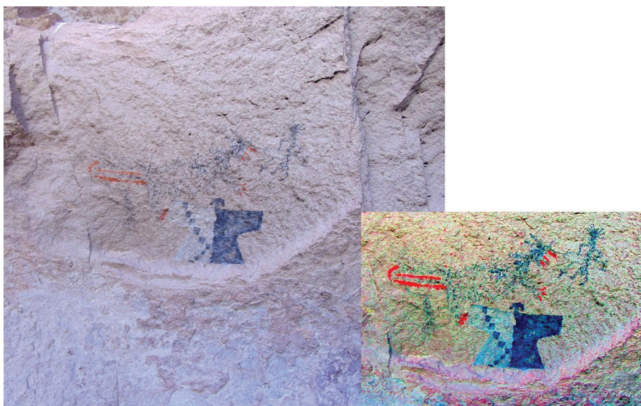
Figura 6. Escena de enfrentamiento entre felino y antropomorfo, y representación tardía de antropomorfo T; imagen de detalle tratada digitalmente con D-Stretch

Para el Periodo Medio, una de las características del repertorio iconográfico es la figura del felino, ya sea representado como tal o desde sus atributos principales (manchas del pelaje, fauces, garras, cola larga y enroscada, etc.). Se destaca un motivo compuesto por un felino y un antropomorfo donde el primero parece estar acechando/atacando al segundo, configurando una escena de enfrentamiento (figura 6). El antropomorfo se representó también de forma dinámica, con cuerpo y cabeza en norma frontal, pero piernas y pies orientados hacia la izquierda en dirección al felino. Otros atributos del antropomorfo son un adorno cefálico radiado (¿plumas?), y un arco y flecha apuntando hacia el animal.