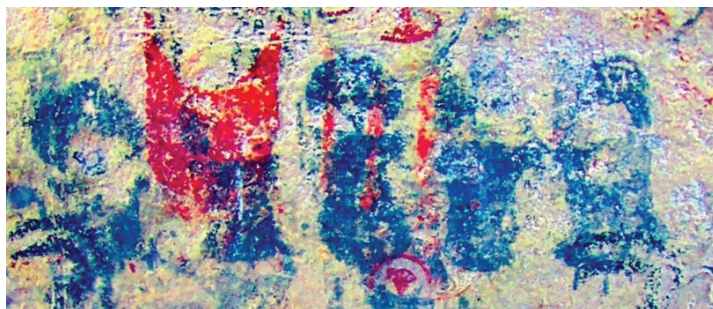
Figura 10. Superposición de unkus sobre escutiforme; imagen tratada digitalmente con D-Stretch

personajes de Huaicohuasi estén portando un casquete con plumas similar al que fue registrado en el contexto funerario inka del Llullaillaco y que pertenecía al ajuar que acompañaba a uno de los cuerpos: la Doncella (Velárdez Fresia, 2018) (figura 11).