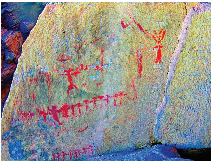
Figura 4. Representaciones antropomorfas, periodo Formativo; se observa superposición de figuras de camélidos con diseño característico del Tardío; imagen tratada digitalmente mediante D-Stretch

Dentro de los figurativos, la tendencia de un predominio de lo antropomorfo ha sido reconocida también para las modalidades estilísticas formativas en ANS (Aschero, 1999), lo cual refuerza temáticamente la adscripción cronológica tentativa que proponemos para estas representaciones de Huaicohuasi.