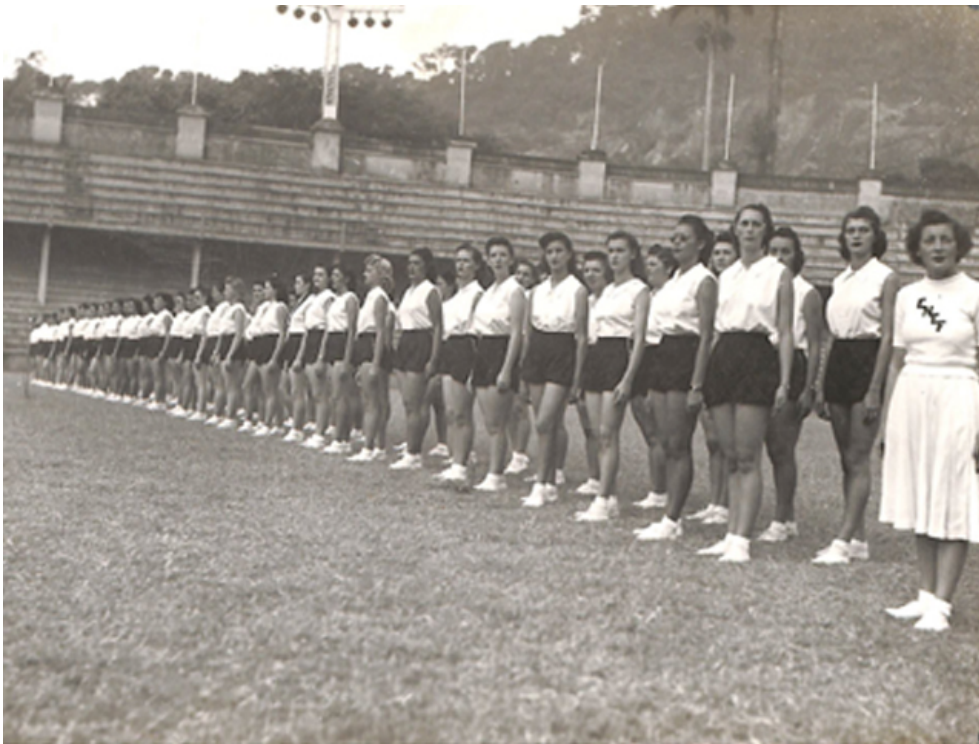
Figura 4 Alumnas en la exhibición Escola Nacional de Educação Física e Desportos (ENEFD) en las instalaciones de Fluminense F.C. (CDH, DNEFDyR 1672, p. 8)

Se destaca la realización de demostraciones separadas por sexo-género, desarrollando hombres y mujeres prácticas corporales diferenciadas, tal como se observa en las fotografías sobre desfiles de alumnos y alumnas. La entonación del himno nacional es un punto a remarcar como refuerzo de la construcción de la identidad local, en tanto ritual que también se llevaba a cabo en los institutos de formación docentes argentinos. Como sostiene Víctor Andrade de Melo (2007), el papel de las políticas del Estado Novo para la construcción de la Educación Física fue fundamental: el régimen autoritario implantado en Brasil por Getúlio Dornelles Vargas, que llegó al poder tras un golpe de Estado el 10 de noviembre de 1937 y se mantuvo en él hasta el 29 de octubre de 1945, fue clave para desarrollar la Escola Nacional de Educação Física e Desportos (ENEFD) de la Universidade do Brasil, fundada el 17 de abril de 1939. En efecto, según este autor, la educación física estaba ligada a un proyecto de seguridad nacional, algo mucho más complejo que simples preocupaciones de una disciplina escolar.