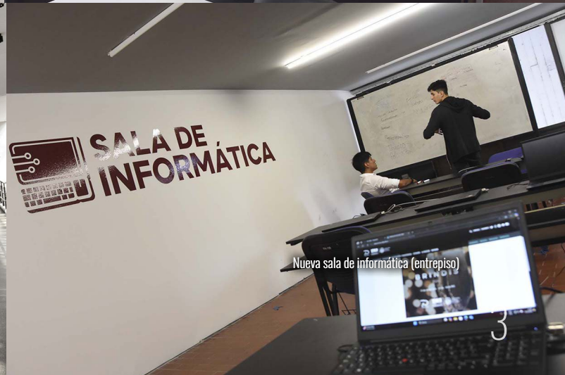
Nueva sala de informática (entrepiso)