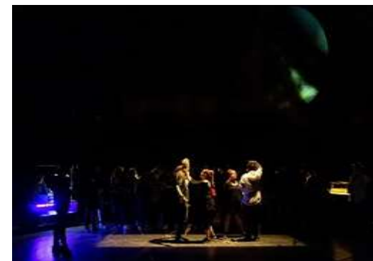
Fig. 1 LabCet (Laboratorio de Creación Transdisciplinar) Empatía 7. CENESTESIA / Antropología de las sensaciones

A partir de obras anteriores como In situ o la reacción humana (1) (2002), U=energía interna (2) (2007) y Empatía (3) (2012), se busca generar una experiencia activa y transformadora en el espectador, en la que éste no sea solo un observador, sino un participante en el proceso creativo y en la conexión con su interior en el aquí y ahora.