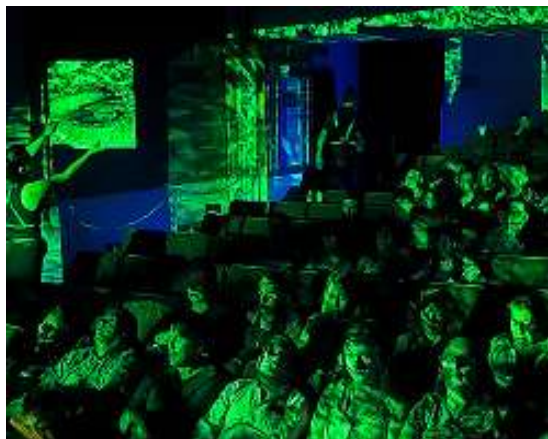
Fig. 3 “Alu*Cine o Cine de Párpados” - Experiencia performática e inmersiva donde el cuerpo del espectador es la pantalla, guiándolo a un viaje interior que suspende la sobreestimulación cotidiana y altera sutilmente los estados de consciencia.

Este proceso no es solo estético, sino también transformador a nivel espiritual.