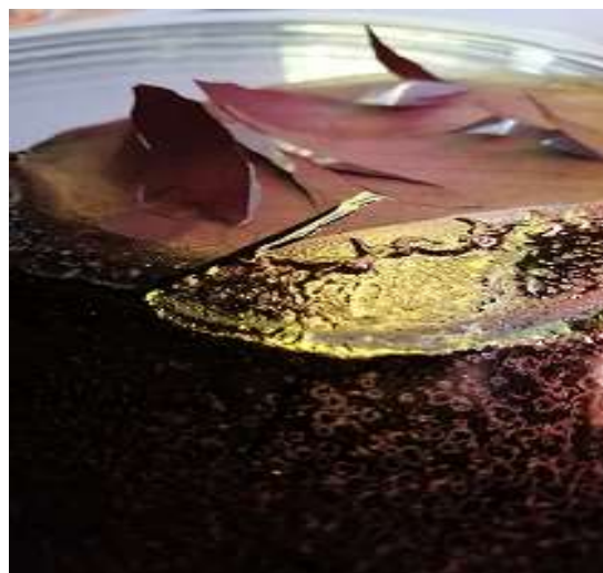
Fig. 4 "Patzoa ñinis" Diálogo entre la herencia afectiva y la herencia biológica, pieza realizada para la exposición Mitocondria: Inmersión en el linaje materno

comprensión más completa de lo que significa ser humano y su conexión con la creación de mundos posibles.