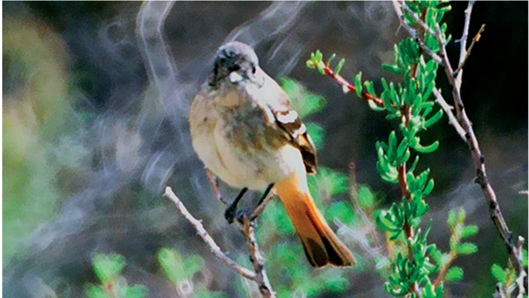
Figura 4. Ejemplar hembra de Knipolegus hudsoni fotografiado luego de la salida del nido. Nótese el vientre blancuzco, el pecho flamulado (estriado difuso).

al nido, sino que se posó primero en la chilca ubicada junto a la cavidad, y luego se desplazó por el interior de ésta hasta alcanzar el hueco. En dos ocasiones, se registró su ingreso al nido, observación realizada detrás de la vegetación, y a una distancia de 4 y 30 m respectivamente. No se observó ningún macho cerca de esta hembra. Fitzpatrick (2004) señaló que durante el cuidado parental en muchas especies de Tyrannidae, la hembra elabora el nido e incuba los huevos y ambos sexos, por lo general, alimentan a los pichones. Agnolín et al. (2009) no aportaron detalles sobre la conducta de los ejemplares referidos. Al respecto, cabe destacar que observaciones realizadas sobre la viudita chica en Neuquén (Veiga et al. , 2002) documentaron que solamente la hembra fue la encargada del cuidado parental (i.e. alimentación; J. Veiga, com. pers.).