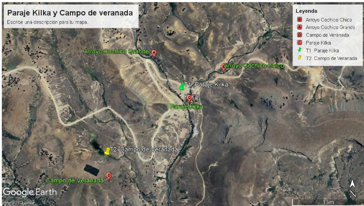
Figura 2. Imagen tomada de Google Earth Pro. Indica la ubicación de Arroyo Cochicho Chico, Arroyo Cochicho grande, el Paraje y el Campo de Veranada. La imagen satelital fue tomada el 18/01/2024.

Campo de Veranada y el otro sobre Paraje Kilka. La Figura 2 muestra la ubicación de los testigos (Testigo 1: 38^{\circ}54'10.75''S ; 70^{\circ}48'52.07''O , Testigo 2: 38^{\circ}54'39.71''S ; 70^{\circ}49'34.94''O ). La extracción de testigos fue realizada con barreno para muestreo de suelo helicoidal tirabuzón de un metro. Los testigos fueron trasladados y conservados para su posterior tratamiento en el Laboratorio de Análisis Ambiental y Geofísica (LAAGEO) de la Universidad Nacional de General Sarmiento (UNGS).