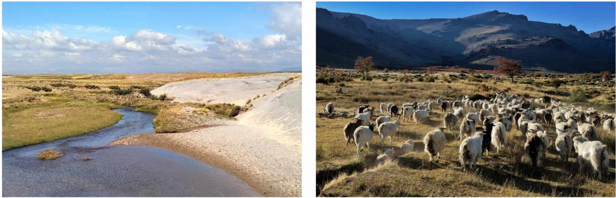
Figura 1. A la izquierda paraje Kilka, confluencia del arroyo Cochico Chico y Cochico Grande. En la derecha campo de veranada, ascenso del ganado al inicio del verano.

acotando los lugares donde alimentar sus animales, sin mencionar que las propiedades privadas ocupan las pasturas más cercanas a los cursos de agua permanente.