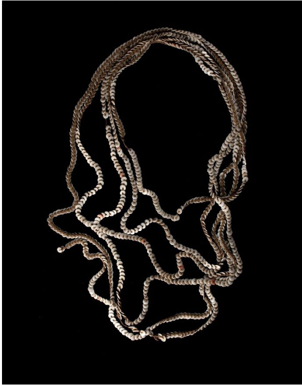
Figura 2. Collar de lentejuelas (pieza no. 931-Grupo Qom/Wichí -Colección Gran Chaco del Museo de La Plata).