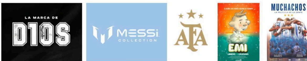
Imagen 3: Marcas del fútbol