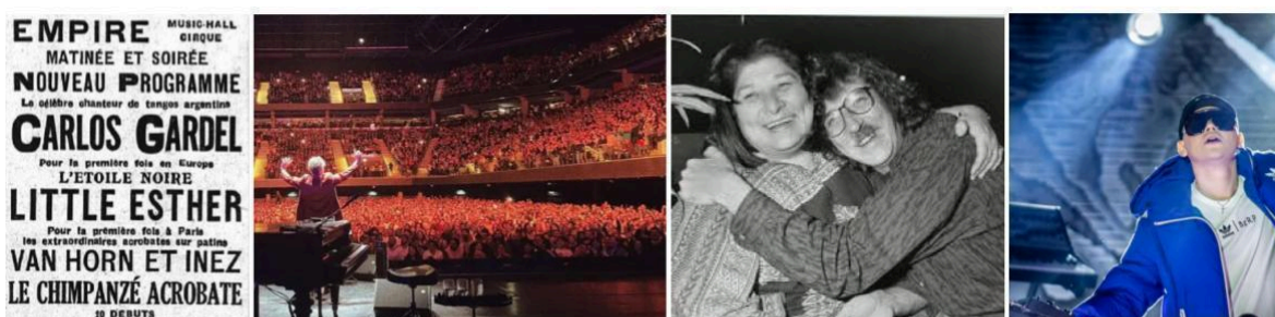
Imagen 6: Argentinidad musical