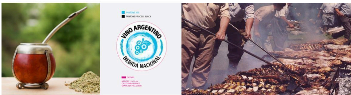
Imagen 7: Identidad gastronómica