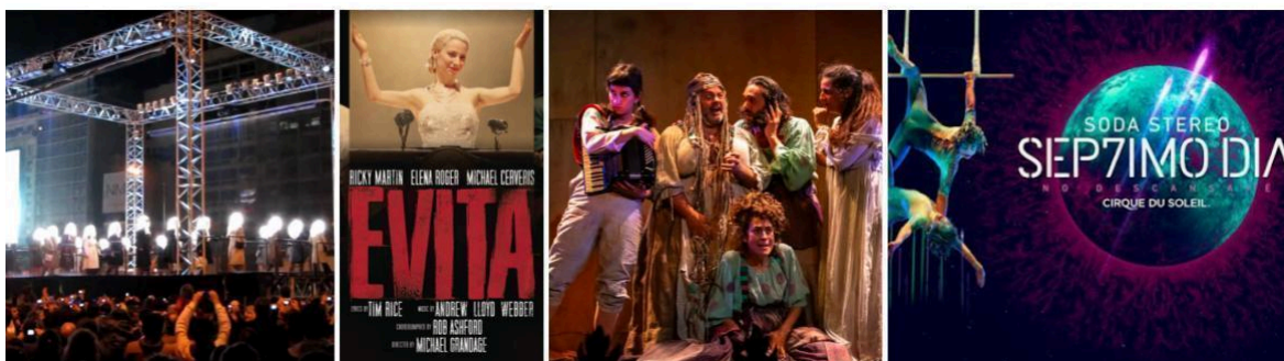
Imagen 5: Teatralidades