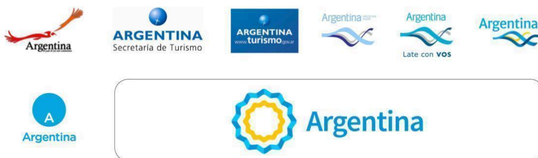
Imagen 1: Isologotipos Marca País Argentina

Fuente: Elaboración propia. Información obtenida en Dirección Nacional Marca País