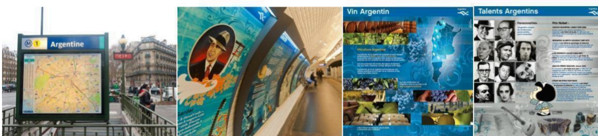
Imagen 8: Argentina en París