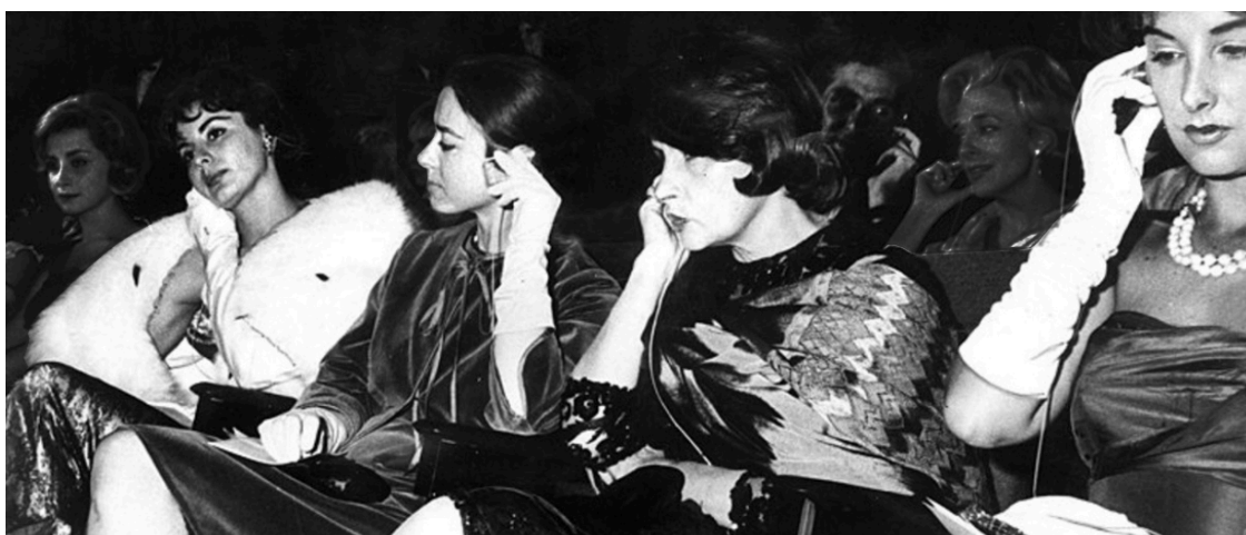
Imagen 4: Divas argentinas en Berlín

El Día del Cine Nacional se celebra el 23 de mayo en homenaje a la primera película argentina. Estrenada en 1909, es un filme que relata los sucesos de Buenos Aires de 1810 13 (Cine Nacional, 2023). El trabajo de una larga lista de directores y artistas, y la proliferación de centros de formación académica y experimental a lo largo del siglo XX, logró posicionar al cine argentino como uno de los más desarrollados de América Latina. En 1920, Carlos Gardel ya filmaba películas en Nueva York instalando el tango a nivel mundial (Pigna, 2020). Además, fue pionero de lo que muchos años después conoceríamos como videoclip, realizando cortometrajes del recién estrenado cine sonoro.