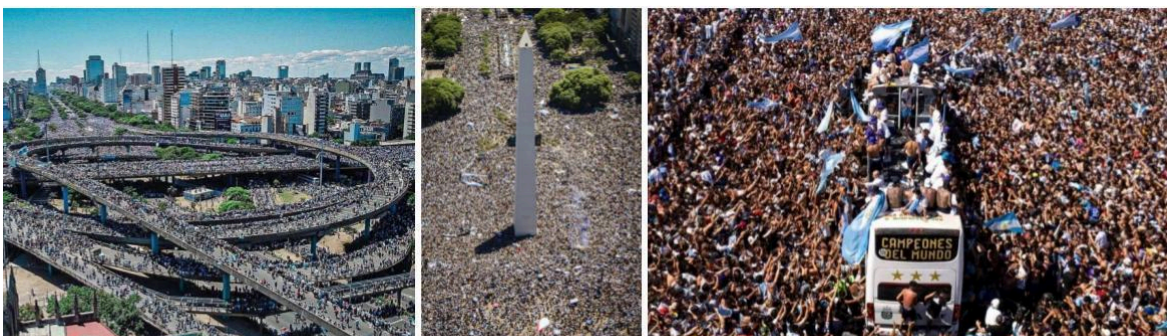
Imagen 9: Mundialistas