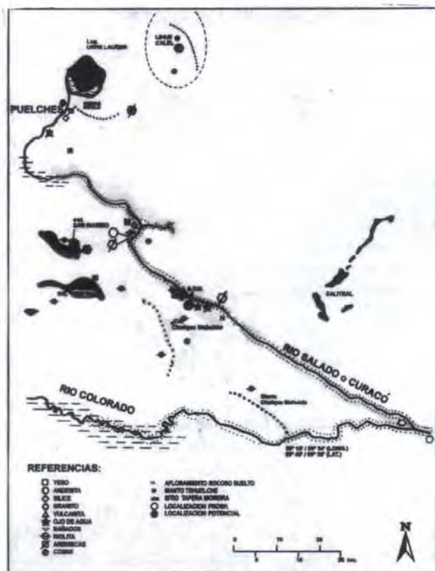
Figura 3. Base Regional de Recursos Líticos del Área del Curacó

Para la confección del mapa se utilizó información geológica que diera cuenta de la presencia de materias primas líticas dentro del espacio regional, delineando un cuadro preliminar de la base de recursos (Figura 3). Se consideró una lista amplia de rocas con fractura concoidea (cuarcita,