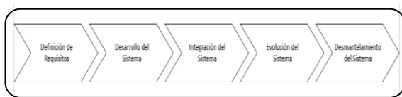
Figura 2: Fases del proceso de desarrollo de los Sistemas de Información

El desarrollo de sistemas es la actividad de crear nuevos sistemas o modificar lo existentes. El proceso de desarrollo se refiere a todos los aspectos del proceso desde la identificación de los problemas para resolverlos u oportunidades para explotarlas, hasta implementar y refinar la solución elegida [5]. Las fases del proceso se muestran en la figura 2.