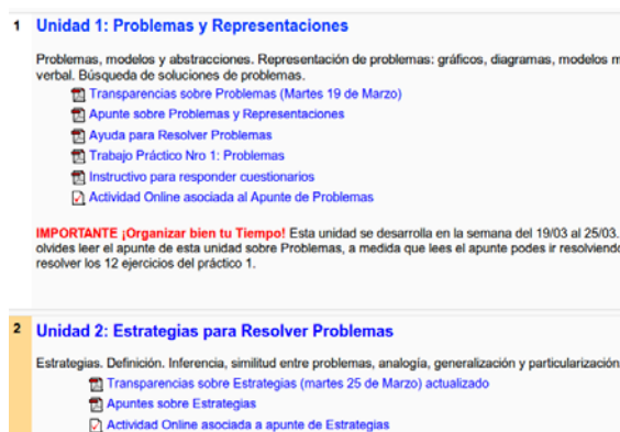
Figura 2. Organización de los contenidos por unidades temáticas.

Existen diferentes configuraciones que pueden ser utilizadas en la diagramación y estructuración de los materiales y demás elementos de un curso. La experiencia lograda desde el año 2005 permite observar que los alumnos no logran visualizar o encontrar de manera eficiente todo el material abarcado en la cátedra.