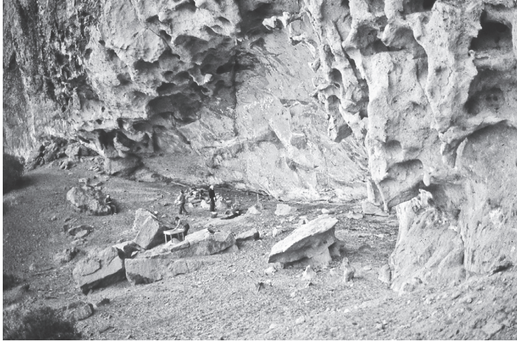
Figura 2. El alero en 1979, antes del inicio de las excavaciones

El alero está ubicado en la margen norte del río Chubut y emplazado en la pared derecha del cañadón La Buitrera, perpendicular al río con una orientación N-S y una extensión de aproximadamente 3,5 km. Las paredes o bardas del cañadón en los primeros kilómetros tienen una altura de 50 metros y presentan algunos puntos de subida hacia los campos altos a través de sendas escarpadas (Bellelli 1988; 1991).