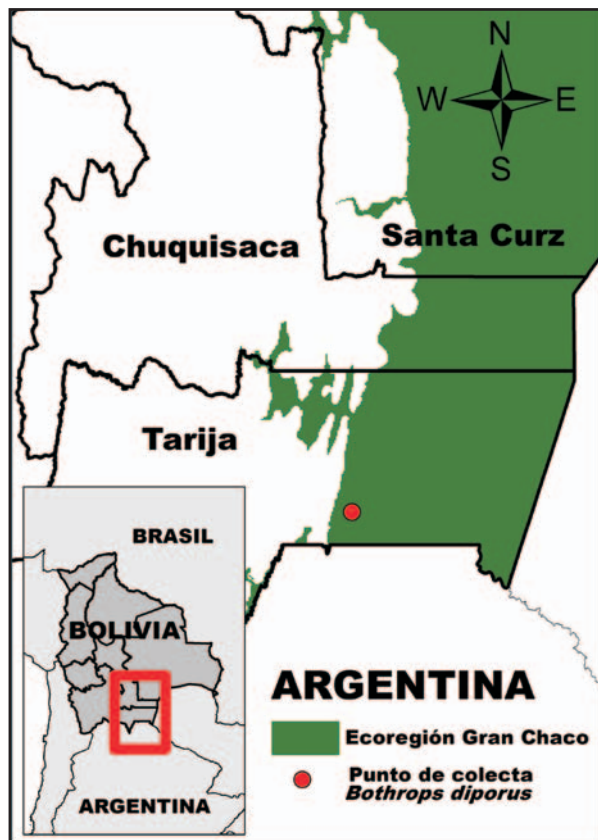
Figura 2. Mapa de ubicación del punto de colecta del ejemplar de Bothrops diporus (ILS-R 20) en el Departamento Tarija, Bolivia.

Viperidae). Zoological Journal of the Linnean Society 156: 617-640.