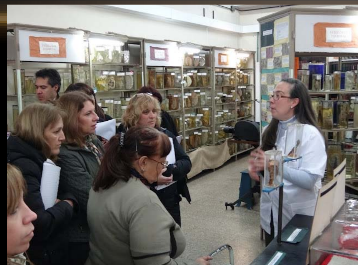
UBA cumple 190 años

En el evento mencionado el Museo fue visitado por 4000 personas. La organización constó de visitas autoguiadas con personal distribuido estratégicamente para las dudas o comentarios que pudieran surgir. Notamos el gran interés que tuvieron especialmente por ciertas unidades temáticas como la patología perinatal, los tatuajes, las malformaciones en animales y patología ya extinguidas como la viruela.