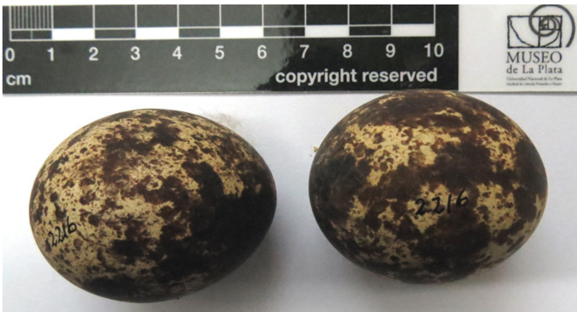
Figura 5: huevos de Caracolero Rostrhamus sociabilis colectados por Pablo Girard en Manchalá, Tucumán.