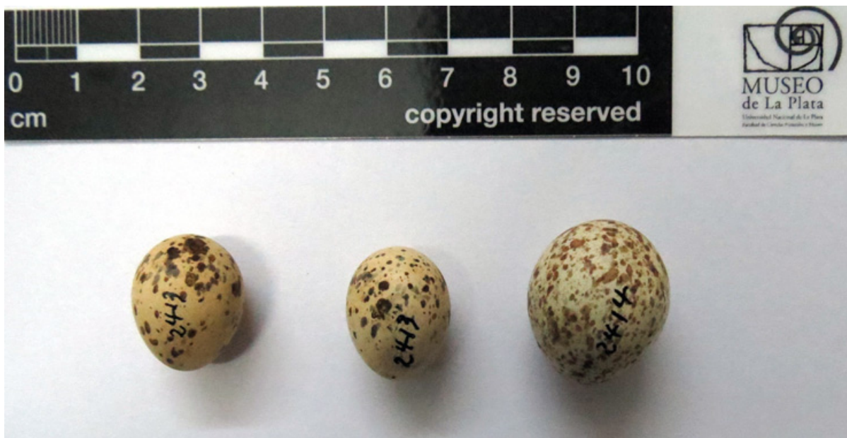
Figura 9: dos huevos de Churrinche Pyrocephalus rubinus y un huevo parásito de Tordo Renegrado Molothrus bonariensis colectados por Pablo Girard en Manchalá, Tucumán.