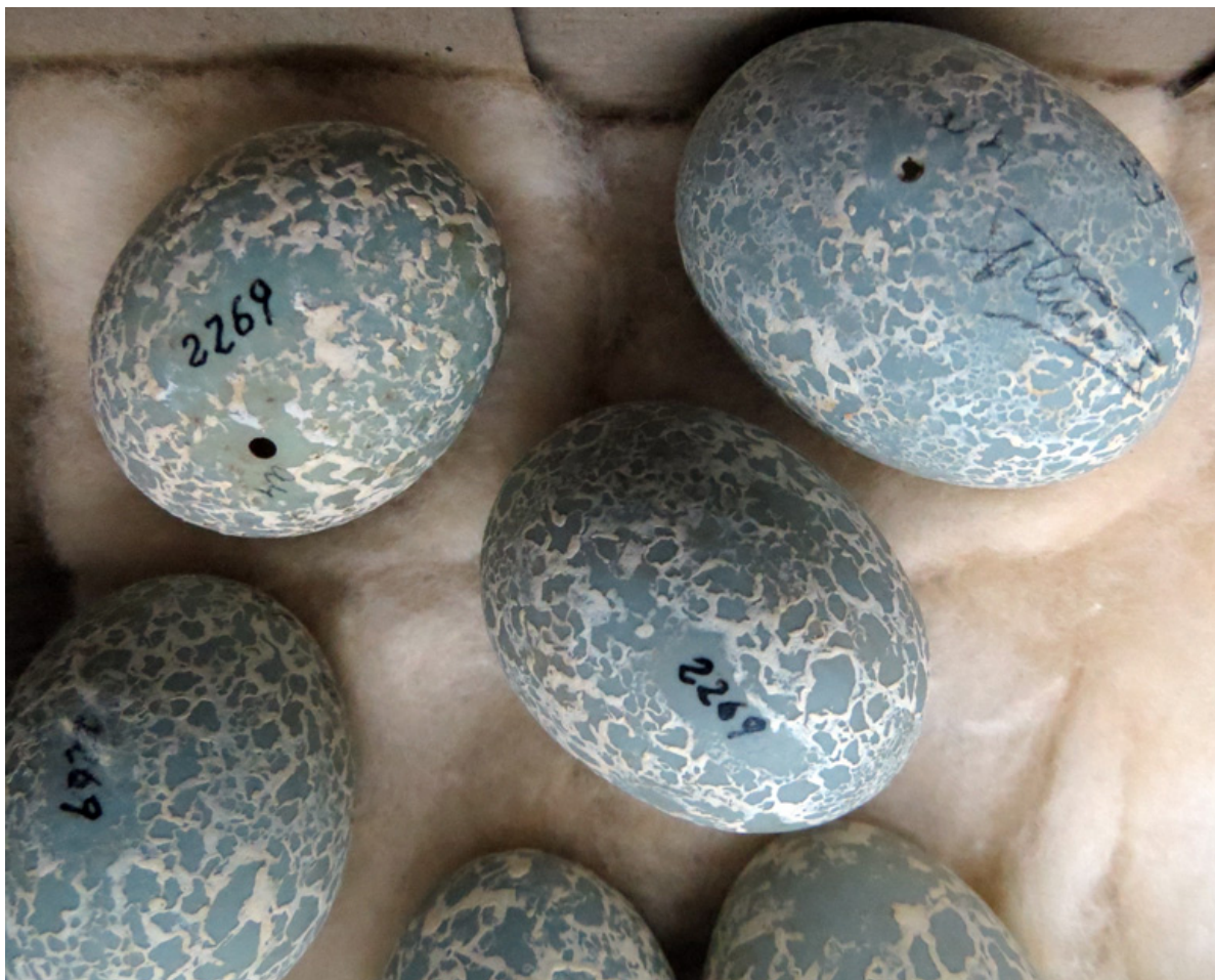
Figura 7: huevos de Pirincho Guira guira colectados por Pablo Girard en Manchalá, Tucumán.