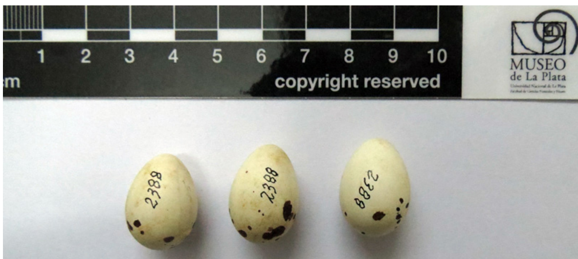
Figura 8: huevos de Suirirí Amarillo Satrapa icterophrys colectados por Pablo Girard en Manchalá, Tucumán.