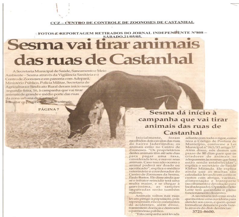
Figura 6. Recorte de jornal demarcando a ação do CCZ na repressão à presença de animais no setor urbano do Município de Castanhal