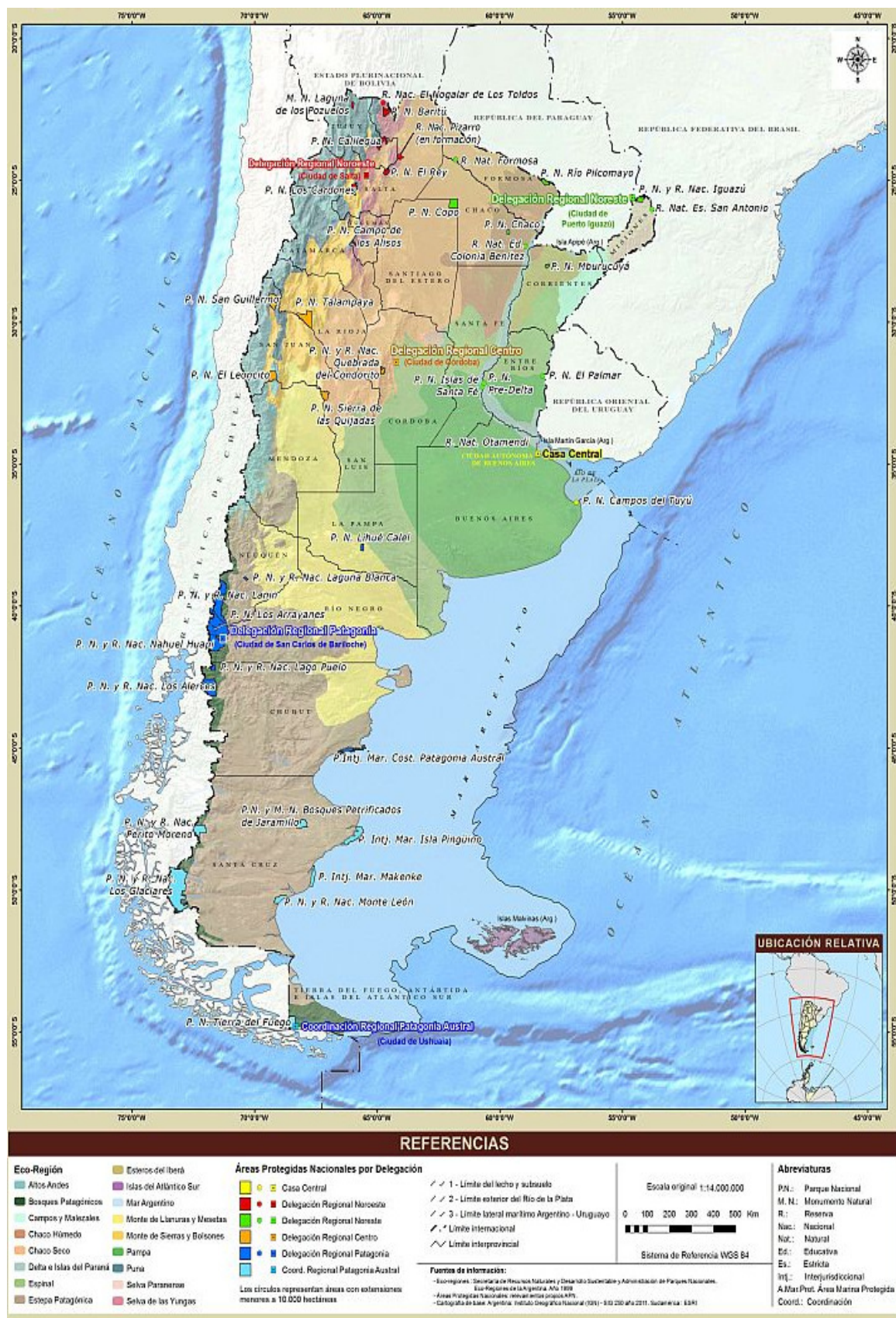
Figura 1: ANP nacionales y ecorregiones de la Argentina