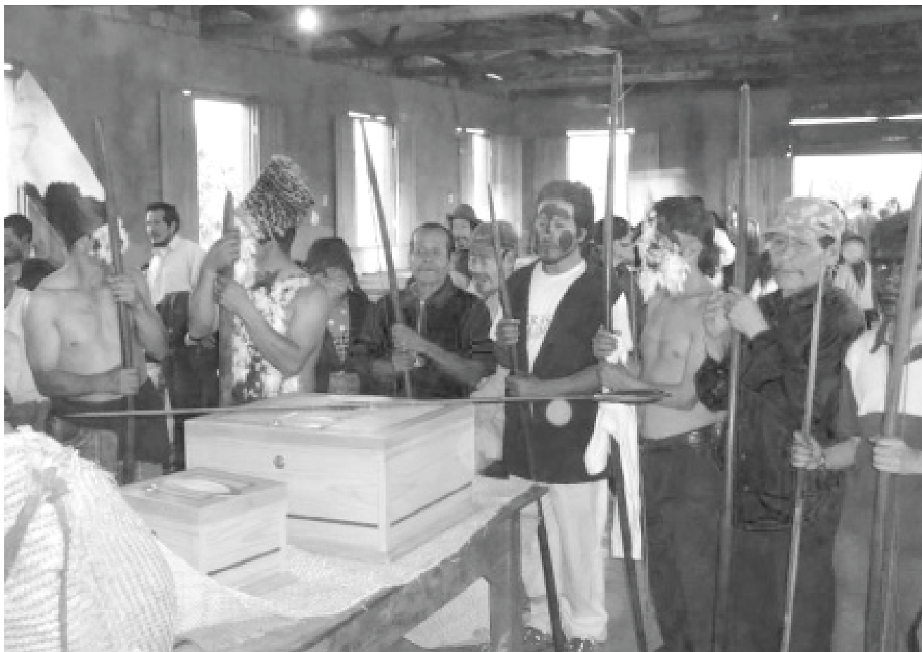
Rituales en el templo de Ypetimi.

al nomadismo de sus primeros años de vida.