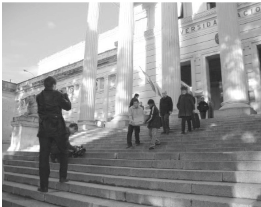
Partida de las urnas desde el Museo.

Los documentos institucionales y las publicaciones antes mencionadas no solo acreditaron la identidad de los restos humanos sino que también permiten conocer gran parte de la