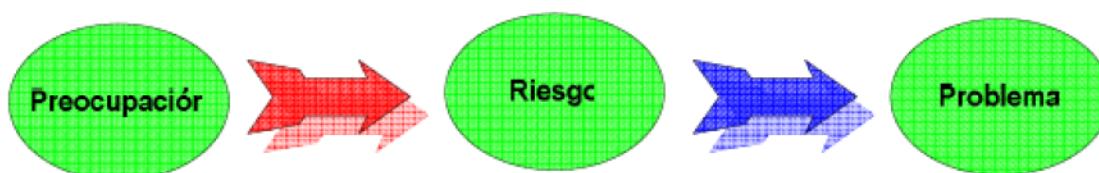
Figura 1 Preocupaciones, Riesgos y Problemas

Suele ser común el confundir preocupaciones, riesgos y problemas: mientras que una preocupación es cualquier situación sobre la cual existen dudas en algún determinado contexto y que, por lo tanto, será evaluada como un posible riesgo, un problema es un riesgo que, efectivamente, se ha producido (véase Figura 1 - Preocupaciones, Riesgos y Problemas).