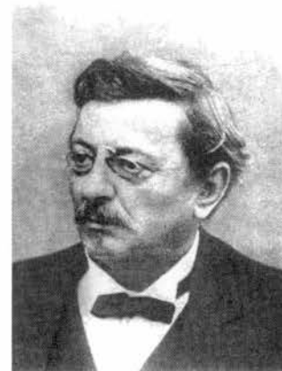
Fig. 3. Eduardo L. Holmberg (1852-1937).