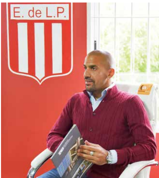
Juan Sebastián Verón