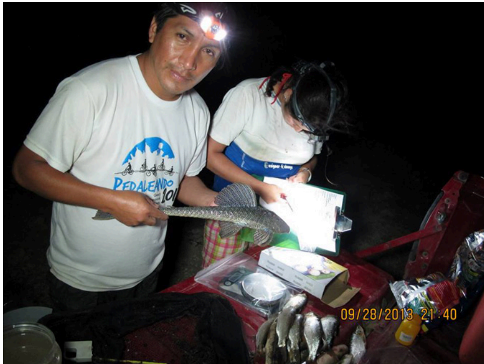
Monitoreando de noche peces en el río Daule, provincia del Guayas, Ecuador, septiembre de 2013 (ambas fotografías)