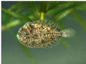
1 Achirus scutum Pleuronectiformes - Achiridae "Lenguado"

La provincia de Los Ríos está ubicada en la región costa o litoral del Ecuador. Presenta un clima tropical con temperaturas que oscilan entre los 22 a 33 °C. Debido a que su relieve es plano ha favorecido mucho a las actividades agrícolas y la construcción de infraestructura de riego y control de inundaciones; lo que también ha propiciado una gran destrucción de sus ecosistemas naturales terrestres y acuáticos. Sin embargo, aun presenta una gran variedad de flora y fauna principalmente asociada a los ecosistemas acuáticos. Presenta un sistema hidrográfico muy denso considerando el tamaño de la provincia. Los principales ríos que conforman este sistema son: Babahoyo, Caracol, Catarama, Ventanas, Macul, Zapotal, Vinces, Quevedo, y varios humedales denominados Abras de Mantequilla. Presenta un recorrido de norte a sur y se une al gran río Guayas antes de desembocar en el Océano Pacífico. Dado el desconocimiento de la ictiofauna, existe un gran interés científico sobre este grupo de fauna de aguas interiores del Ecuador y ha sido motivo de estudio de naturalistas e investigadores durante los últimos años. Sin embargo se ha prestado poco interés sobre las potencialidades de este recurso. Este trabajo se realizó principalmente dentro del marco de estudios ambientales propiciados por los proyectos de riego y control de inundaciones de la provincia de Los Ríos.