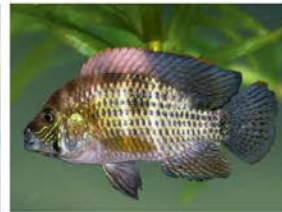
3 Andinocara rivulatus (hembra) Perciformes - Cichlidae "Vieja azul"