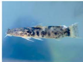
7 Astroblepus grixalvii Siluriformes - Astroblepidae "Bagre"