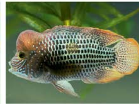
4 Andinocara rivulatus (macho) Perciforme - Cichlidae "Vieja azul"