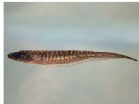
8 Brachyhypopomus occidentalis Gymnotiformes-Hypopomidae "Bio-bio"