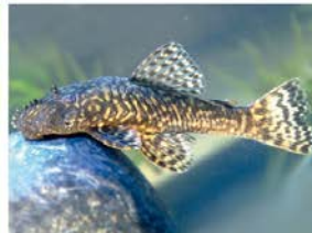
2 Ancistrus clementinae Siluriformes - Loricariidae "Raspabalsa"