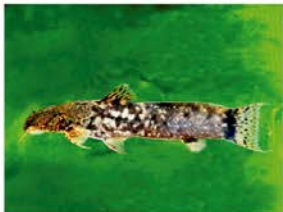
5 Astroblepus chotae Siluriformes - Astroblepidae "Bagre"