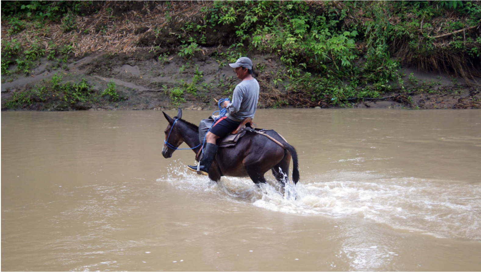
Cruzando el río Brito en época lluviosa para el muestreo de peces, Río Verde, Esmeraldas, Ecuador, mayo de 2015