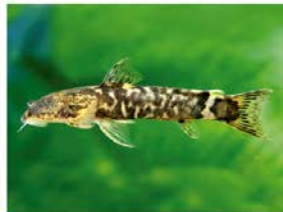
6 Astroblepus cyclopus Siluriformes - Astroblepidae "Bagre"