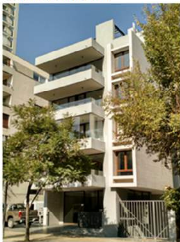
Figura N° 7: Obra nueva. Edificio residencial. Avenida Presidente Riesco, 2015