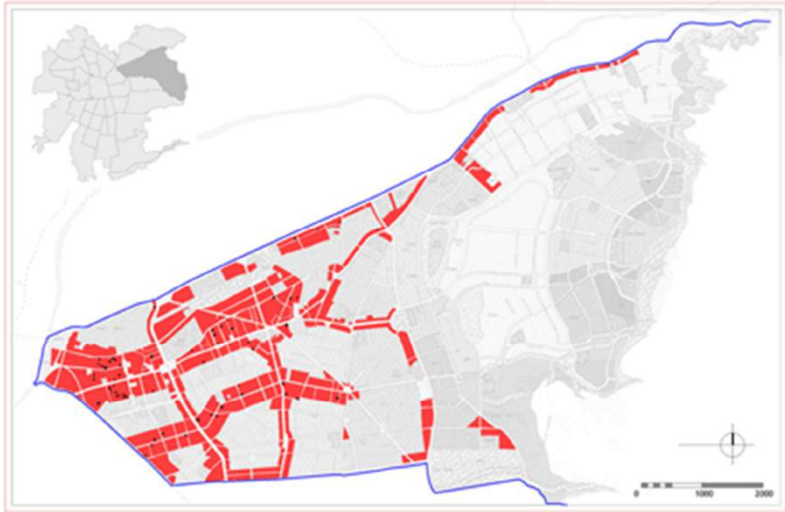
Figura N°4: Plano Regulador de la Comuna de Las Condes que incluye las zonas afectas a la normativa de predio residual pro densificación. Fuente: https://www.lascondes.cl/informacion_comunal/plan_regulador.html intervenido por los autores de la investigación.

La zona fue catastrada durante el segundo semestre del año 2014, identificándose 118 predios con superficie inferior a la mínima exigida rodeados de suelos densificados, 56 presentaron destino habitacional por lo que se entendieron como potenciales oportunidades para acoger la normativa en sus dos opciones, el resto de los predios presentaron cambio de destino con algunos casos acogidos a la normativa especial de predio existente residual de densificación y siete proyectos de obra nueva, cinco con destino vivienda. La evolución en la adopción de la normativa obedece a que la disponibilidad de predios es consecuencia del desarrollo de proyectos de densificación, proceso que inicialmente ocurrió en las zonas con destino comercial y de servicios profesionales, para luego extenderse a las zonas de destino habitacional, que es donde existe mayor resistencia a la densificación y por consiguiente es en la que se generan los predios residuales, caracterizados por edificaciones de viviendas en las que los usuarios intentan mantener las condiciones originales utilizando estrategias de amortiguación.