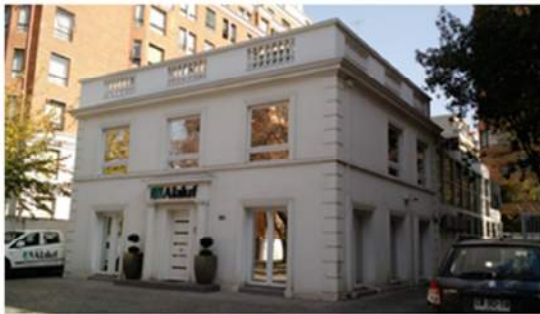
Figura N° 5: Edificio acogido a cambio de destino. Calle Hendaya, 2014

En el total de proyectos desarrollados se observó la búsqueda particulares opciones que acogieron inquietudes y necesidades no resueltas en sectores en que existe uniformidad respecto de la oferta, que independiente de servir a una mayoría no asume sensibilidades distintas, habitualmente representadas por segmentos etarios y composiciones familiares distintas a los estándares, que aunque minoritarias es necesario cubrir. Oportunidad que otorga la producción de predios de menor dimensión y por consiguiente menor tamaño de proyecto, aparentemente menos intensiva en el uso de recursos y de menor tiempo de comercialización.