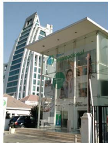
Figura N° 9: Obra nueva. Edificio comercial. Calle La Pastora, 2014