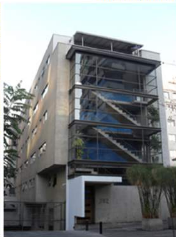
Figura N° 8: Obra nueva. Edificio residencial. Calle Carmencita, 2012