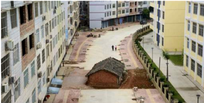
Figura N°1: Casa que permanece en la mitad de una Avenida en la ciudad de Nanning en Guanxi en el sur de China. 13/04/2015

Frecuentemente los desaciertos de los procesos de densificación urbana se ejemplifican con la imagen de las casas islas: situaciones urbanas en que se evidencian casos emblemáticos del rechazo a la densificación ocurridos en distintos lugares del mundo que incluso han servido como argumento para historias cinematográficas (Figura N°3) o caricaturas que intentan desacreditar procesos (Figura N°2), suelen transversalizar el tema e instalarlo en el dominio popular, debido a que probablemente el impacto que provoca la incomprensión del deseo de algunos de conservar sus condiciones originales, románticamente conecta a los individuos con las injusticias que lo han afectado, por lo que producen empatía e incluso generan reacciones de rechazo respecto del bienestar del que disfrutaban o al que aspiran: mejores conectividades, acceso a diversidad de equipamiento, ahorro en los tiempos de desplazamientos y disponibilidad de oportunidades de interacción y encuentro son atributos que la densificación promueve y que en la medida en que hayan sido instalados a través de un proceso participativo e inclusivo que haya convocado a todos los sectores ciudadanos, reconociendo particularidades y sensibilidades, considerando alternativas e incorporando estímulos que promueven el respeto por la diversidad, la identidad y la mixtura urbana.