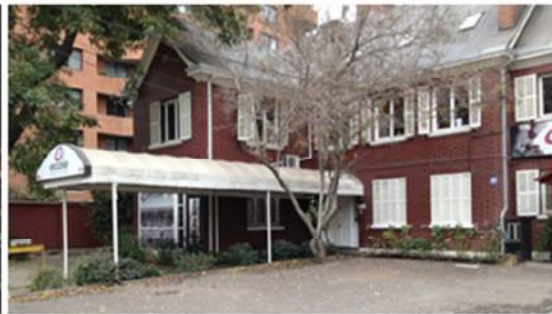
Figura N° 6: Edificio acogido a cambio de destino. Avenida Américo Vespucio, 2014