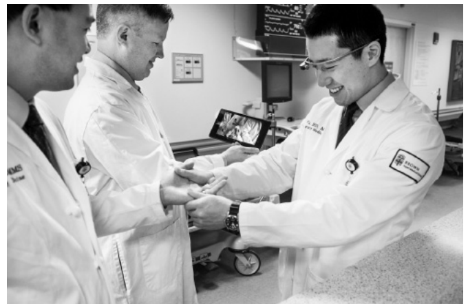
Ejemplo de empleo de Google glass en el diagnóstico dermatológico en el Hospital de Rhode Island, EE.UU.

Los pacientes eran examinados por médicos residentes que durante la consulta utilizaban Google glass que transmitía video en tiempo real de los hallazgos del examen físico al especialista en toxicología. A su vez, el especialista podía guiar al médico residente a través de mensajes de texto que aparecían en el cristal. También se enviaban fotos de los estudios realizados, como por ejemplo electrocardiogramas. Para proteger la privacidad del paciente cada dispositivo contaba con una plataforma que encriptaba la información enviada.