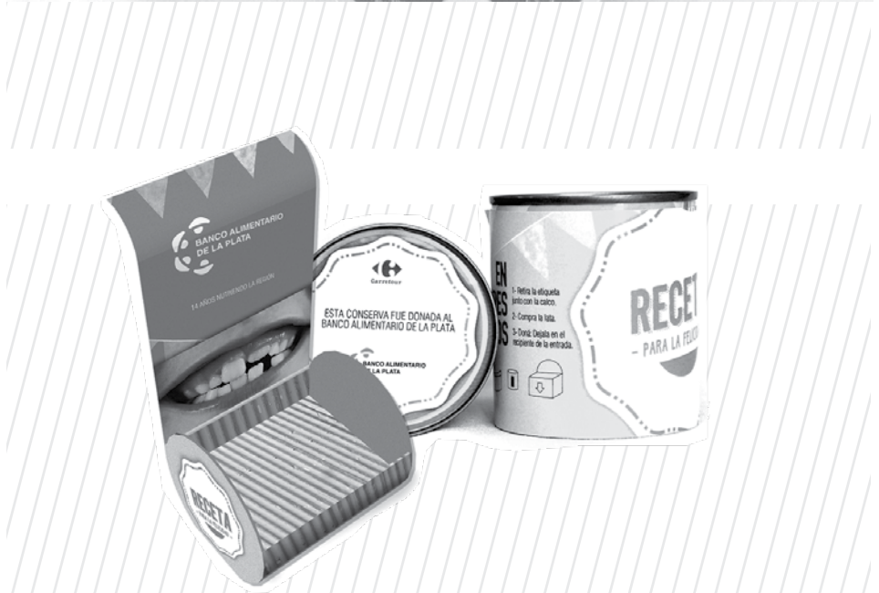
Figura 5. Activación en supermercados locales mediante la donación de conservas. Las latas disponen de una doble etiqueta que se retira al donarla para que el contribuyente pueda llevarla e informarse acerca del Banco