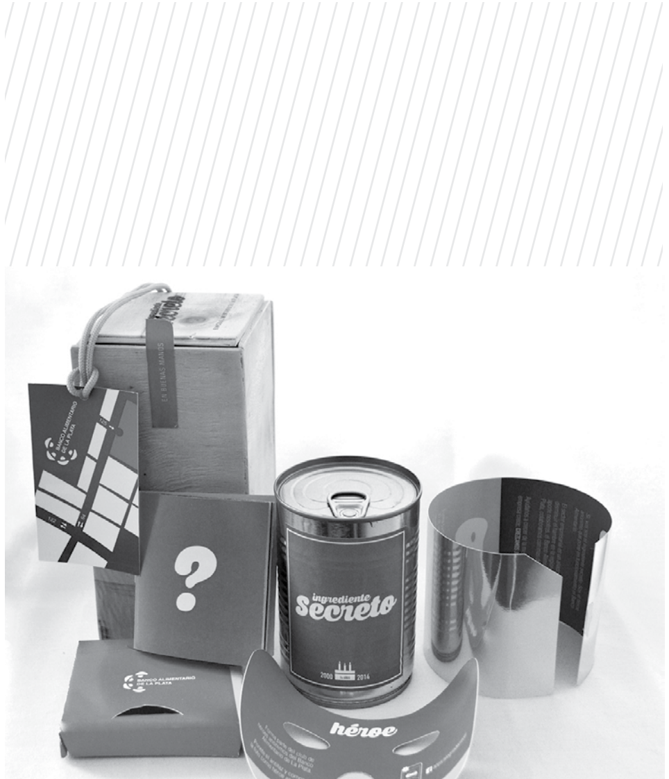
Figura 4. Invitación a la cena anual del Banco para empresarios locales