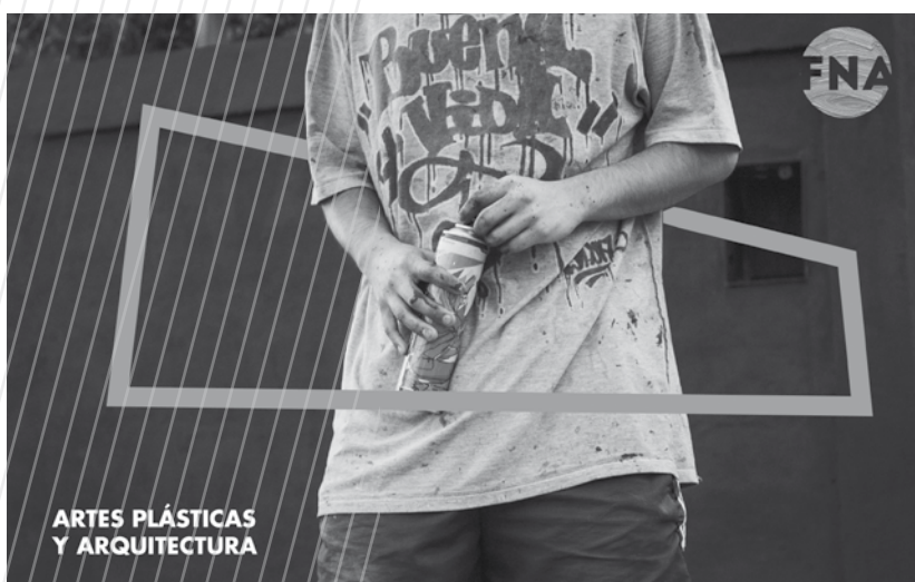
Muestra de la utilización del sistema diseñado, en este caso, de Artes Visuales

Para el desarrollo del trabajo de tesis se planteó una nueva imagen visual para el FNA y para la Casa de la Cultura. El público al que se dirigió fue joven, entre dieciocho y treinta y cinco años, con