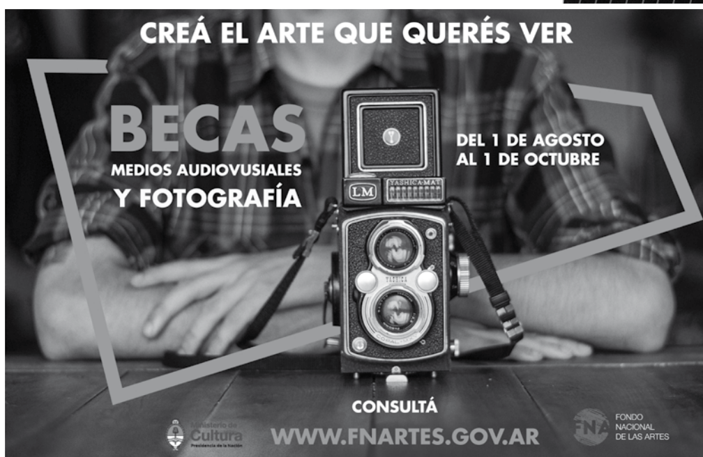
Afiche de promoción a inscripción de becas

El rediseño de la marca se centró en los conceptos arte, dinamismo e improvisación y se tomó como referencia la figura geométrica del círculo, sobre la cual se apoyan las siglas del FNA caladas. Esta figura circular tiene como característica una textura vectorial que semeja un bosquejo o un boceto realizado con lápiz o con algún objeto de escritura. La lección de esta textura partió del análisis sobre qué características unían a todas las ramas culturales que abraza el FNA, algo complejo y muy amplio, pero se llegó a la conclusión de que siempre existe un proceso creativo, el llamado brainstorming , que lleva a tener un lápiz y un papel para bajar esa idea a un boceto que luego concluirá en la obra final.