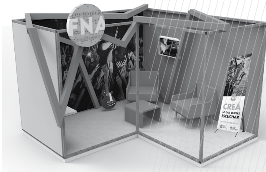
Render de uno de los stands

En cuanto a la página web, se buscó que fuera llamativa, de fácil acceso a la información básica necesaria y abarcada, en su mayor parte, por imágenes de gran tamaño y con cada sección identificada con los colores corporativos y con los recursos gráficos ya explicados. Se programó para que fuera responsive para otros dispositivos como celulares y tablets . Otro recurso que se desarrolló para las redes fue un spot publicitario bastante dinámico y atractivo, acompañado con música y con imágenes en movimiento.