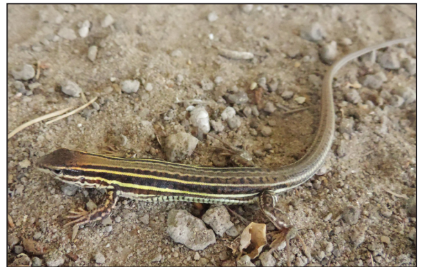
Figura 2. Contomastix serrana UNNEC 12354.

Comentarios — Los registros de distribución de Contomastix serrana son principalmente en las sierras de las provincias de Córdoba, San Luis y Santiago del Estero (Cei y Martori, 1991; Cei, 1993; Pérez et al. , 2004; Avila et al. , 2013). Sin embargo, la única población hallada en un área protegida es la que se encuentra en la llanura chaqueña en el Parque Nacional Copo, en la provincia de Santiago del Estero (Arias y Lobo, 2005). Así como en otras especies del género, tales como C. leachei y C. vittata , se conoce muy poco sobre el rango de distribución de C. serrana (Fig. 1). Una de las posibles causas de esto es que estas especies son de hábitos sigilosos, viviendo