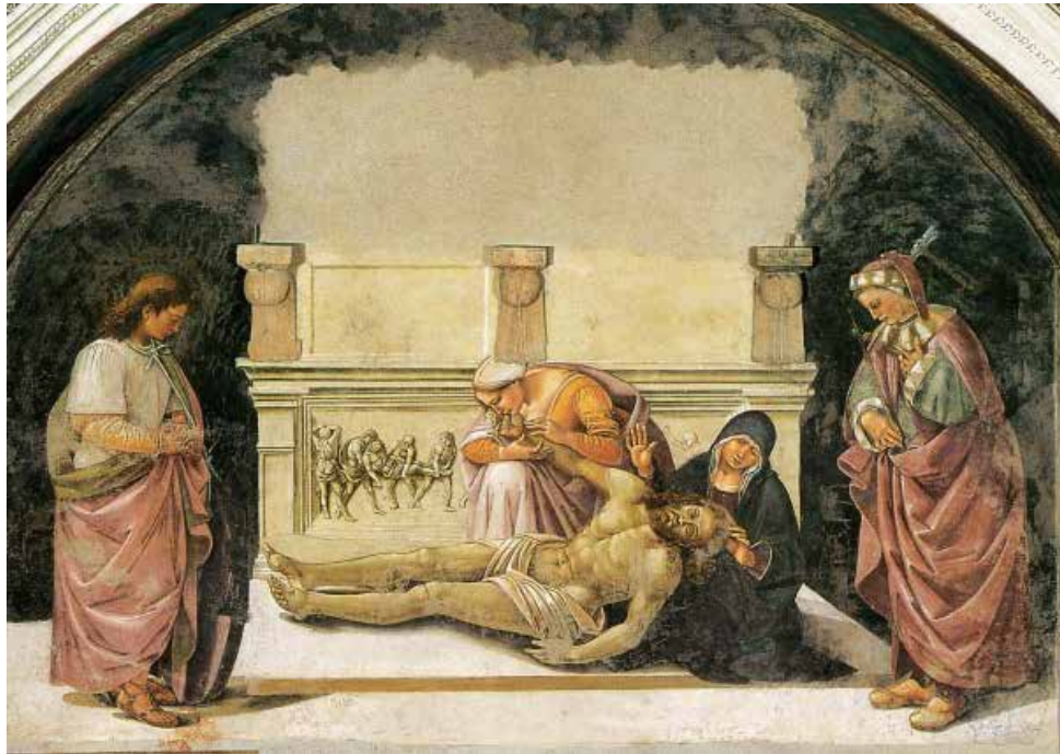
Figura 1. Pieta (circa 1499-1504), Luca Signorelli. Capilla de San Brizio, Catedral de Orvieto

vez, cercanos a un relieve tallado sobre la tumba que representa un enterramiento. La escena resulta un esquema de las ideas warburgianas: los personajes del relato bíblico se lamentan con gestos patéticos de dolor alrededor de un Cristo de musculatura esculpida a los pies de una tumba antigua, donde una silenciosa escena cuenta los sucesos pasados señalando la procedencia arqueológica del lenguaje convocado [Figura 1].