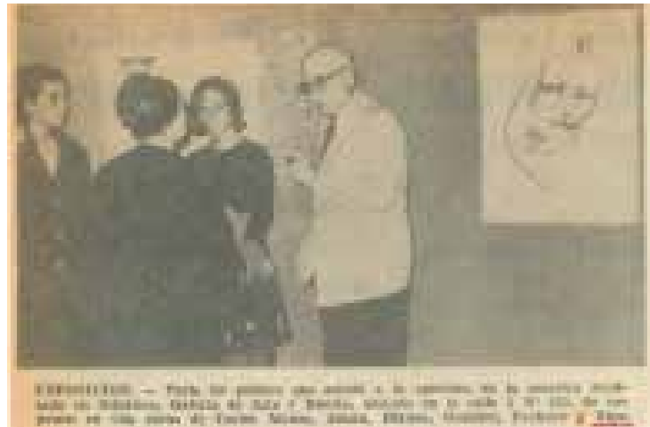
Figura 1. Fotografía de una exposición en la Galería del Asterisco, La Plata. El Argentino , 1 de mayo de 1965

A pesar de la fragilidad de los registros, resulta factible afiliar esta práctica —junto con su participación también fugaz en el MAN— con las concepciones por él teorizadas ese mismo año. No obstante, esta visión se discontinúa en la compilación de Bayón donde Yurkievich sostiene: