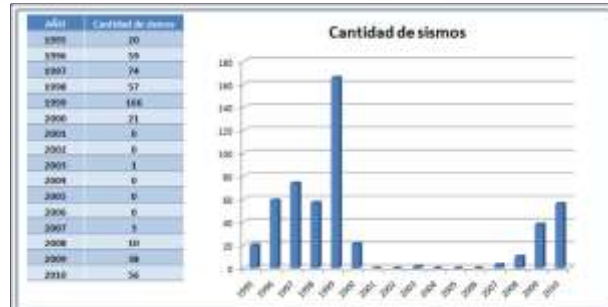
Figura 2: Cantidad de sismos que ocurren cada año en la zona de estudio. Se observa la ausencia de información entre 2000 y 2008. Un análisis posterior indica que la misma se debe a falta de datos que alcancen los criterios considerados en este trabajo.

El análisis de los 505 sismos superficiales determinados por este trabajo, evidencia diferentes zonas con mayor sismicidad dentro de la región de estudio. Estadísticas basadas en los datos procesados, reflejan que en las proximidades de la represa Cuesta del Viento ocurren en promedio alrededor de 90 sismos superficiales por año (considerando el período 1996-1999) (Fig.2), de los cuales aproximadamente el 90% corresponde a microsismicidad (magnitud <2,5) (Fig.3). Por otro