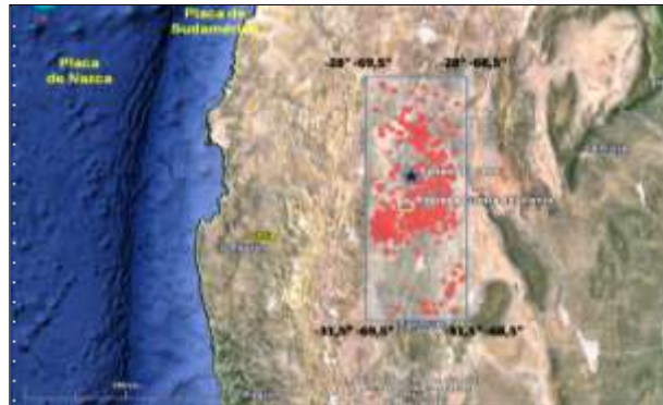
Figura 1: Mapa de la zona de trabajo. El recuadro gris delimita la zona de interés y los círculos rojos representan los sismos estudiados. Se muestra la ubicación de la represa Cuesta del Viento y el epicentro del terremoto de 1894 según datos del INPRES.

Si bien no se conoce una localización calculada con exactitud para su fuente sísmica debido a que no existen registros instrumentales para esa época, si es posible realizar un análisis sismotectónico de la región que considere la actividad sísmica moderada a pequeña más reciente ocurrida en este sector de la Precordillera sanjuanina.