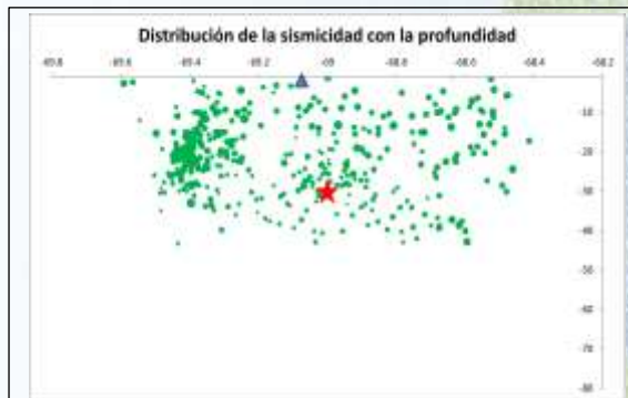
Figura 4: Distribución de la sismicidad con la profundidad. El triángulo indica la ubicación de la represa Cuesta del Viento y la estrella simboliza el terremoto de 1894 según datos de INPRES y Giesecke et al., (2004).

El análisis de profundidad focal para la distribución de sismicidad estudiada, muestra un aparente límite inferior en las profundidades de las localizaciones. Alrededor de los 40 km de profundidad, a partir del cual, no se obtuvieron localizaciones de focos sísmicos (Fig.4). Estos resultados se condicen con diferentes hipótesis que sugieren que la sismicidad superficial se concentra en la parte superior de la corteza, donde la roca tiene un comportamiento más rígido. Según las localizaciones obtenidas en este trabajo y a partir de estos estudios de la estructura de corteza (Ammirati et al., 2016),