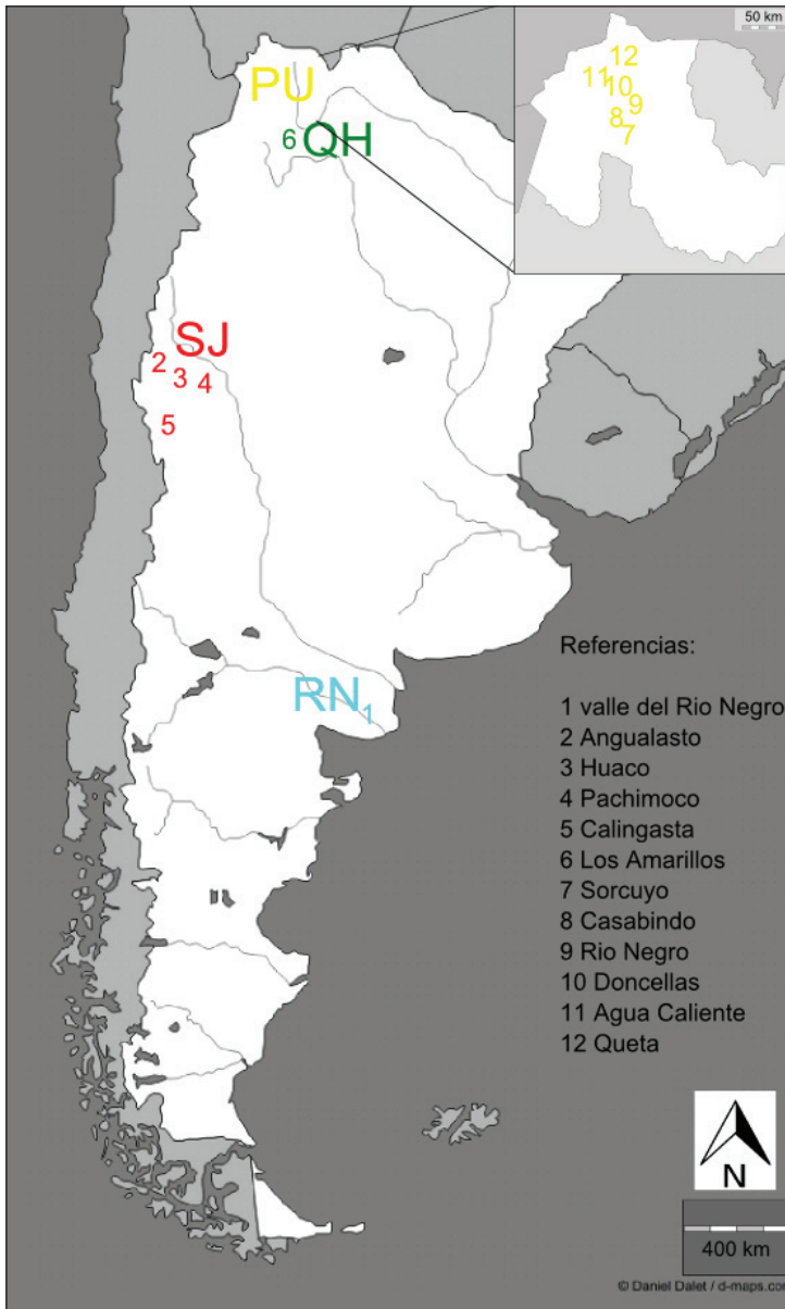
Fig. 1. Mapa exhibiendo la procedencia de las muestras analizadas. Se indica en el caso de San Juan y Doncellas el detalle de los sitios bajo los cuales se agruparon esas muestras. Referencias: PU:Puna (sitios Doncellas, Casabindo, Agua Caliente, Queta, Sorcuyo, Río Negro); QH:Quebrada de Humahuaca (sitio Los Amarillos); SJ:San Juan (sitios Calingasta, Angualasto, Pachimoco), RN:Río Negro (valle del Río Negro).

co y de los recientes datos isotópicos, la cual ha llevado a proponer que los grupos que habitaron esas regiones practicaban distintas estrategias de subsistencia. En el caso de la Puna, las investigaciones más recientes han postulado que el pastoralismo habría sido el principal componente en la economía de estos grupos (por ejemplo, Killian Galván y Olivera, 2008; Miranda De