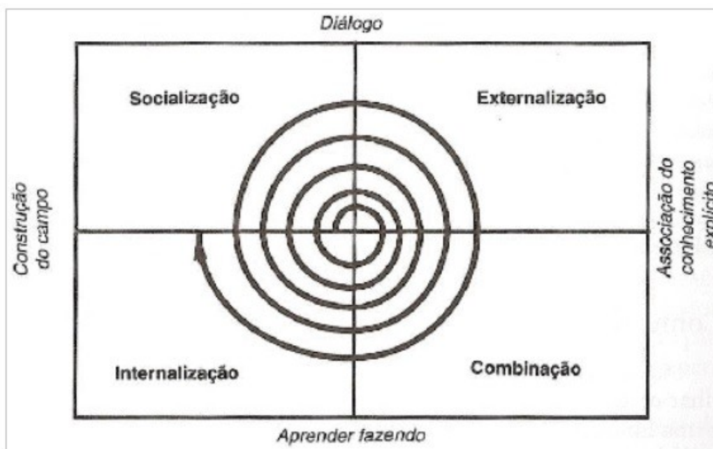
Figura 2. Espiral do conhecimento – Modelo SECI

Inerente à mente humana, o conhecimento é o elemento mais complexo do processo informacional. Depende do contexto, de reflexão, de análise e de síntese. Esse modelo, formalizado por Nonaka e Takeuchi (1997) na espiral do conhecimento, pode ser comparado ao processo do ciclo informacional, se considerar o mecanismo pelo qual a coleta de dados, sua externalização e combinação para a produção de informação será internalizada como construção de novo conhecimento em um momento posterior, o que poderia marcar o final da primeira volta do ciclo. A ativação de novos dados, novamente externalizados e combinados dão origem a nova informação e, quando internalizados, na continuação do ciclo, constroem um novo patamar de conhecimento. A cada volta da espiral, novas informações, novo conhecimento e, portanto, novos dados são produzidos.