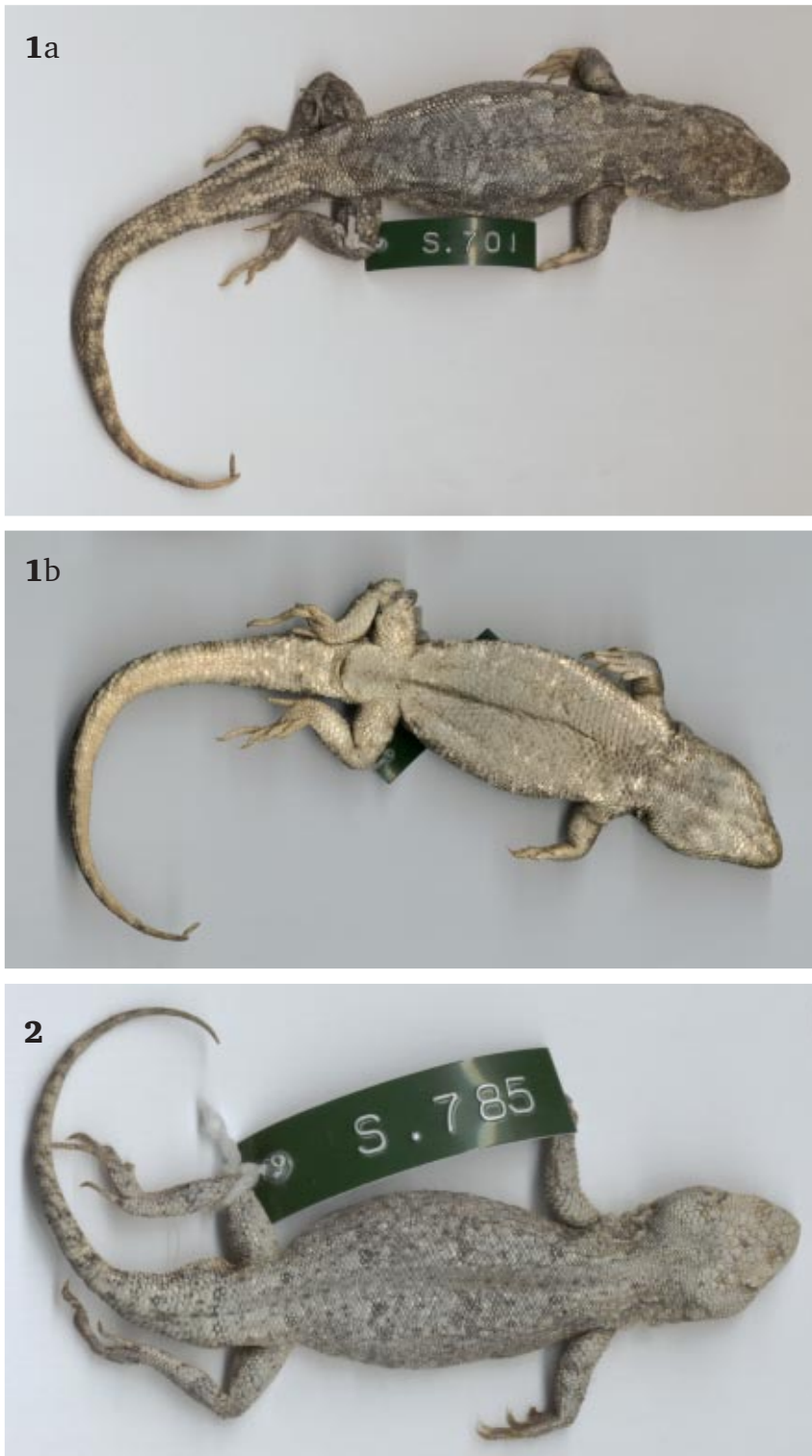
Figuras 1a y 1b. Holotipo de Liolaemus ditadai en vista dorsal y ventral. Figura 2. Macho de la serie tipo de Liolaemus anomalus en vista dorsal.