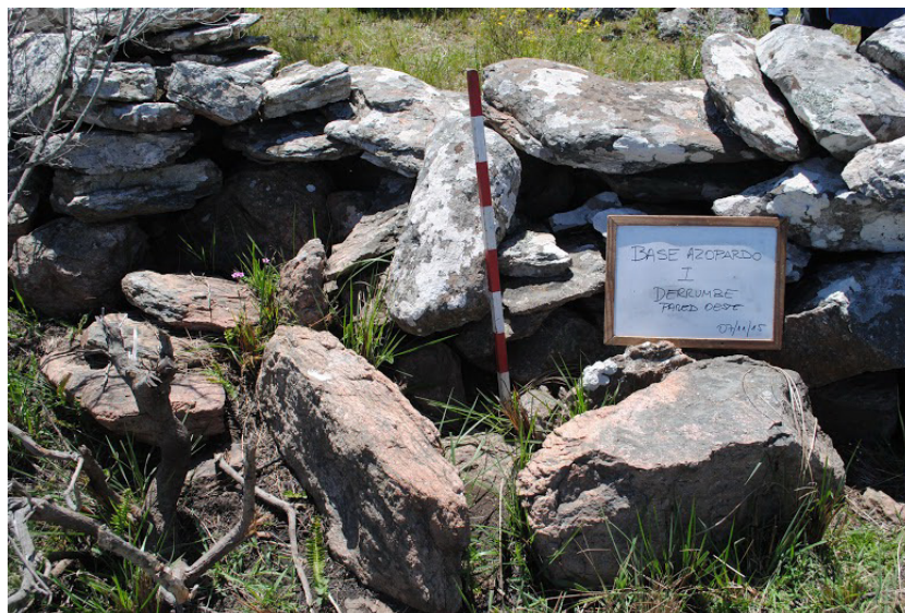
Figura 8. Derrumbe en Base Azopardo 1.