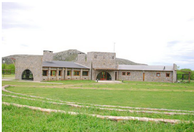
Figura 5. Intervención turística (Parador Boca de las Sierras).

Paralelamente, otros espacios fueron adaptados para un fin turístico: a un kilómetro del Parador se encuentra el Refugio Boca de las Sierras, que consiste en un camping que ofrece actividades de aventura; en el paraje Pablo Acosta, un antiguo almacén de rubros generales fue adaptado como restaurante de comidas típicas, donde también se han construido cabañas.