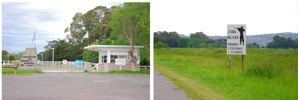
Figuras 3 y 4. Intervenciones militares.

La postura de este grupo de interés es evitar el ingreso de personas no autorizadas en el área. A pesar de numerosos intentos, el gobierno municipal no ha conseguido la donación de las 541 hectáreas declaradas Reserva Natural Boca de las Sierras, que se encuentran dentro del territorio militar.