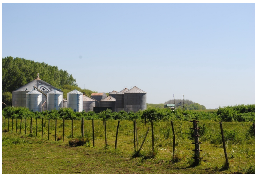
Figura 2. Intervención agrícola-ganadera.

Las prácticas de producción agropecuaria son las más antiguas que se vienen desarrollando en la región y las de mayor impacto. El siglo XIX fue el momento de expansión de la frontera, expulsión de grupos originarios, división, ocupación y apropiación legal de tierras por donaciones y enfiteusis, comenzando a conformarse un paisaje acorde a una lógica productiva occidental basado en estancias, cría de ganado y agricultura que, con fragmentaciones y modificaciones en las tecnologías y tipos productivos, se sostiene actualmente (Infesta, 2003; Lanteri, 2005). La vivencia de estos hechos en el ámbito local ha sido registrada en las entrevistas.