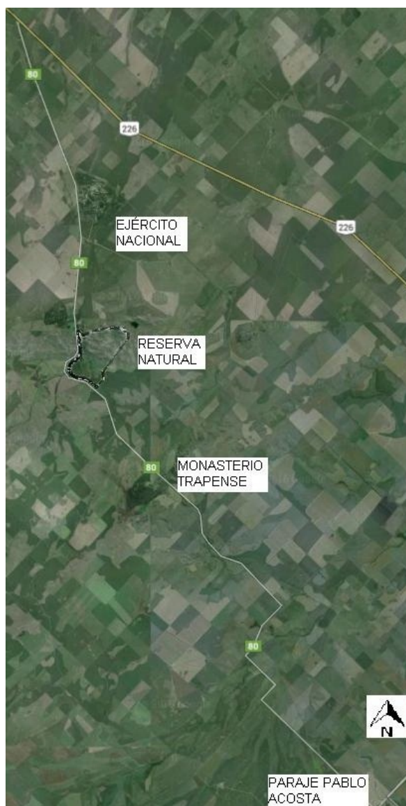
Figura 1. Paisaje Boca de las Sierras en la actualidad.

Con el avance del Estado, el paisaje se fue modificando, en principio fragmentándose en estancias, luego con la extensión del ferrocarril y la fundación de la estación Pablo Acosta (1929) y, posteriormente, asentándose un arsenal naval y una fábrica de explosivos (1945), construyéndose la ruta provincial N° 80 (1952) y un monasterio trapense (1958). Finalmente, en los últimos años, se inauguraron espacios turísticos como un camping (2007) y un parador turístico (Boca de las Sierras) (2012) de llamativa arquitectura. Paralelamente a estas últimas modificaciones materiales del territorio, la preocupación de algunos sectores municipales y científicos referida al valor del patrimonio natural y cultural del lugar llevaron a armar un proyecto con el objetivo contrario: la preservación de 541 hectáreas de dicho paisaje que minimice nuevas transformaciones, mediante la figura de Reserva Natural. Si bien la misma fue declarada en 1999 por la ley provincial N°12.781, nunca ha sido implementada.