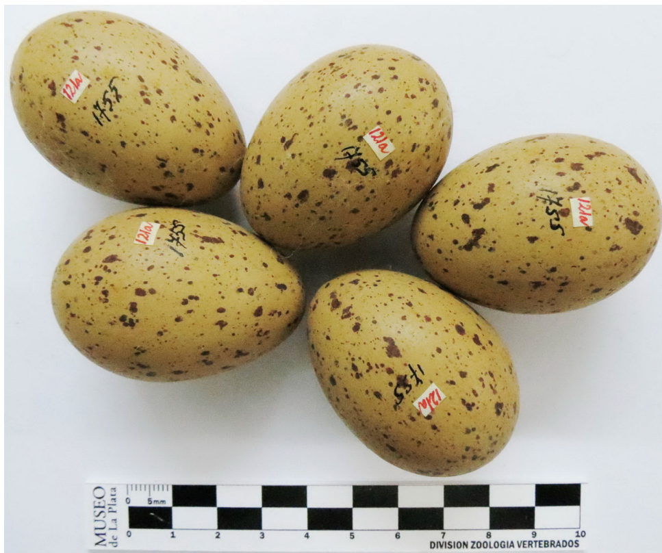
Figura 3. Nidada con cinco huevos de Pollona Común ( Gallinula galeata ) pertenecientes a la colección de huevos Ronald Runnacles del Museo de La Plata. El código escrito en rojo ("121a") representa la identificación de Ronald Runnacles en sus cuadernos de campo y el código escrito en negro ("1755") representa el número de ingreso a la colección oológica del Museo de La Plata.