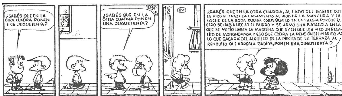
Joaquín Salvador Lavado (Quino) (1993)

a. ¿Cómo se construyen/interpretan los significados entre los personajes de la historieta?