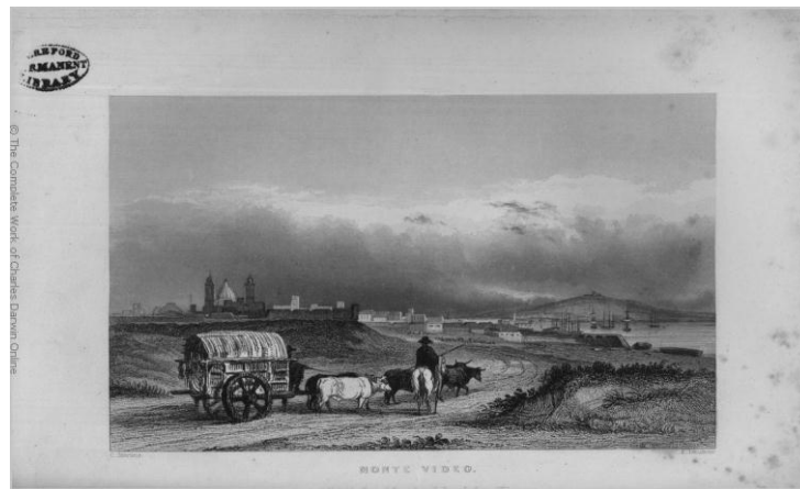
Figura 4: Montevideo

importante y queriendo consultarlas, intenta una visita a dicha ciudad. Atravesando el estuario del Plata y alcanzando a ver ambas orillas lejanas, Darwin comenta que un río de tamaño y dimensiones tan grandes no posee interés ni grandeza, un comentario bastante curioso. Acercándose a Buenos Aires, primero un buque de guardia porteño los intimaba con una serie de disparos de advertencia y al intentar el desembarco, con la intención también de ir a quejarse al ministro inglés en Buenos Aires, Mr. Fox, un bote de cuarentena les impide realizarlo, con el pretexto del cólera. Mientras tanto FitzRoy recibió a un oficial porteño a quien advirtió que de haber sabido que se aproximaba a un puerto “incivilizado”, hubiera tomado las precauciones debidas para poder responder a los disparos y de hecho mandó disponer la artillería del “Beagle” en el caso que debiera