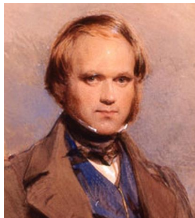
Figura 1: Charles Robert Darwin (12 de Febrero de 1809-19 de Abril de 1882).

Nuestro personaje, Charles Robert Darwin (Figura 1), había nacido el 12 de Febrero de 1809, el mismo día y año que Abraham Lincoln; y aunque trascenderían en la historia por caminos muy diferentes, ambos eran antiesclavistas. Para los que gustan de relacionar fechas, ese mismo año nació el notable escritor Edgar Allan Poe y más especialmente ese año el gran naturalista francés Jean Baptiste Lamarck, publicó su “Philosophie Zoologique” de innegable y trascendental influencia en la idea de la evolución.