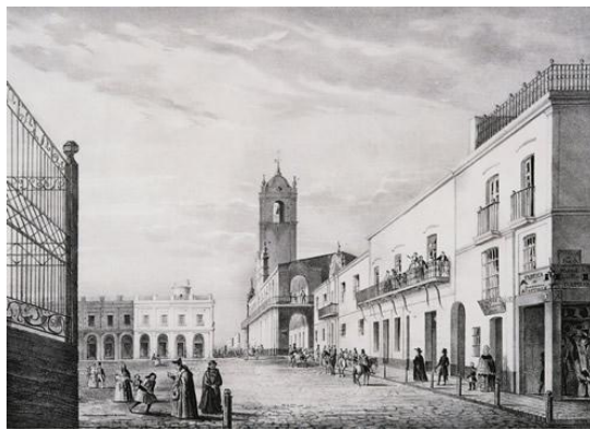
Figura 6: Buenos Aires. El Cabildo y alrededores.

mataderos y el espectáculo obviamente le resulta chocante. Visita a Mr. Victor Hughes, un antiguo compañero de colegio, residente en ese momento en Buenos Aires, a quien le va a transmitir su “pasión por la geología”. Visitan varias iglesias, entre ellas la Catedral, Darwin se muestra impresionado y respetuoso del fervor religioso del ritual católico comparado con el protestante. Le impresiona la igualdad de rangos, mencionando que damas y criadas se encuentran una junto a la otra. No es claro donde se aloja Darwin, ya que menciona a su antiguo amigo Hughes, pero no dice si se queda allí. Cita un hotel cerca de la Catedral y conoce a Mr. Edward Lumb, un comerciante inglés, en cuya casa se hospedará pero en su segunda visita a Buenos Aires (1833). En cuanto a fósiles menciona que con Lumb va a coleccionar conchillas fósiles en un “calcáreo” o “caliza” (¿banco del marino “Belgranense” en las barrancas de Belgrano?). Comenta que Mr. Flint, un comerciante norteamericano, tiene “un diente”, ¡obviamente se debía estar refiriendo a un diente fósil!