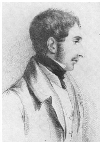
Figura 2: Robert FitzRoy (5 de Julio de 1805-30 de Abril de 1865).

Como parte de un plan de mapeo de las costas y rutas oceánicas llevado a cabo por orden del Almirantazgo Británico, el HMS “Beagle”, un pequeño barco de guerra de tipo bergantín de escolta, modificado a buque de observación, con seis cañones (en lugar de los 10 originales) fue afectado a tales tareas junto con el HMS “Adventure”, realizando su primer viaje hacia Patagonia en 1826, bajo el comando del Capitán Pringle Stokes. La rutina era sumamente estricta y bajo una fuerte presión, el Capitán Stokes se suicidó en el Estrecho de Magallanes en 1828. En Río de Janeiro el comando fue otorgado al joven aristócrata de 23 años, Teniente Robert FitzRoy (Figura 2), quien retornó a Patagonia prosiguiendo la tarea inconclusa. En un incidente en que un grupo