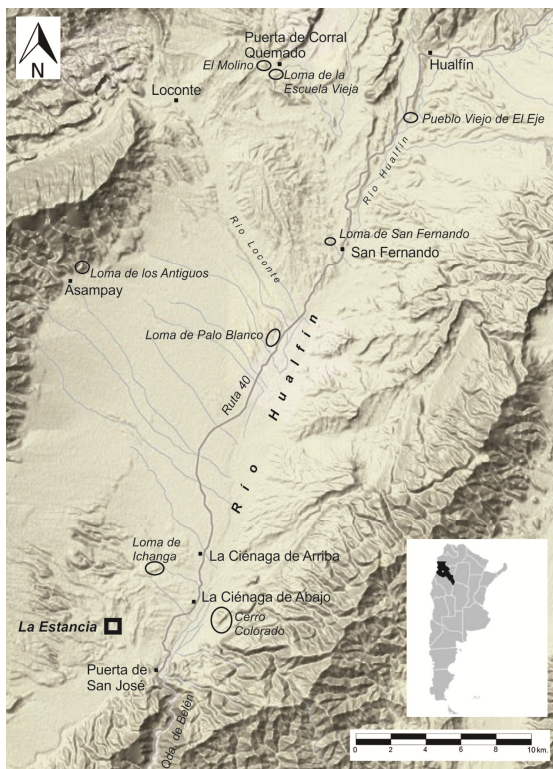
Figura 1. Valle de Hualfín con la ubicación de La Estancia y de los sitios mencionados en el texto.