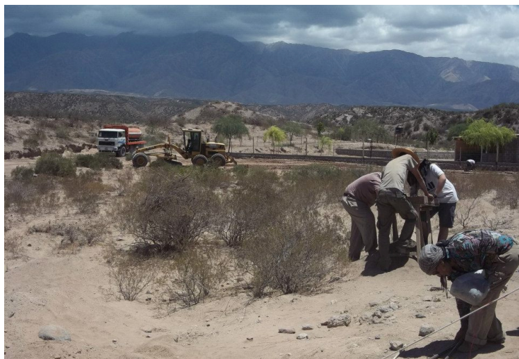
Figura 3. Tareas de limpieza y nivelación del terreno sobre el sector sur del sitio (19/11/2013). Al fondo se observan parte de las nuevas construcciones.

En función de las características del sitio, evaluado a partir del análisis tanto del tipo de asentamiento como de los materiales recolectados en superficie y teniendo en cuenta el peligro en que se halla lo que aún resta del mismo, es que se decidió abordar este espacio para la realización de investigaciones arqueológicas y transformarlo en un lugar de formación del quehacer arqueológico para los estudiantes de la carrera de Antropología de la Facultad de Ciencias Naturales y Museo, de la Universidad Nacional de La Plata, Argentina.