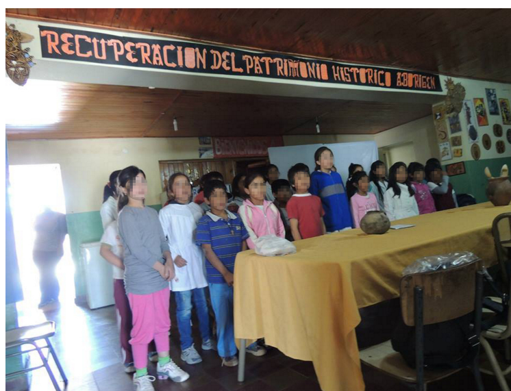
Figura 4. Charla en la Escuela N° 485 de La Estancia.

Con respecto a la propuesta educativa, se cumplieron exitosamente los objetivos centrales de capacitar y entrenar a los estudiantes en diversas tareas del trabajo de campo arqueológico -tanto a nivel individual como en equipo-, reconocer en el terreno diferentes sitios que ejemplifican los modos de vida andinos característicos del Área Andina Central y Meridional y acercar a la comunidad local los conocimientos básicos de la Arqueología como disciplina. Además de las referidas excavaciones de recintos, se estructuraron charlas destinadas a alumnos de dos escuelas primarias de la zona a través de las cuales se expusieron, con un lenguaje sencillo y accesible, los conceptos y aspectos relevantes vinculados con el quehacer del arqueólogo -prospección, excavación, contexto, cronología, interdisciplinariedad, entre otros- (Figura 4).