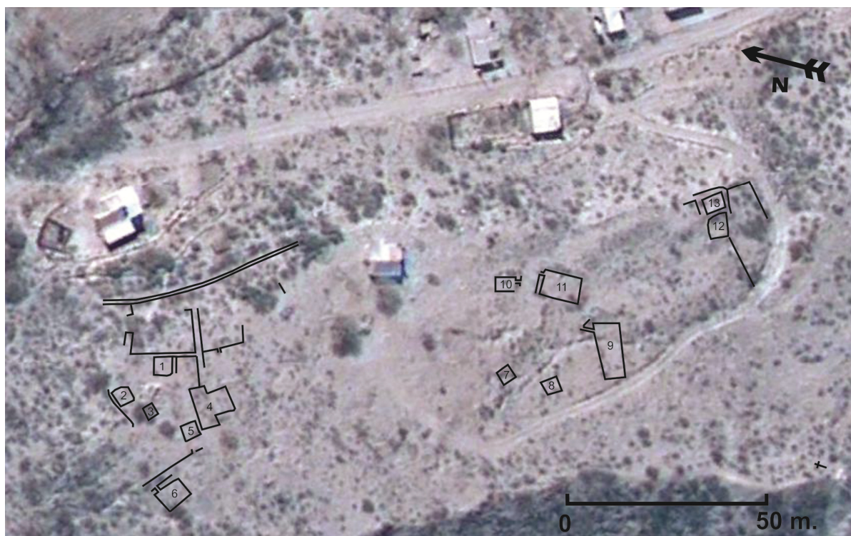
Figura 2. Plano del sitio La Estancia sobre imagen satelital, año 2010.

En el año 2007 el sitio arqueológico La Estancia estaba conformado por un total de 13 recintos, espacios semiabiertos y varios muros de contención, construidos con paredes de piedra o “pircas”, emplazados sobre una lomada baja (Figura 2).