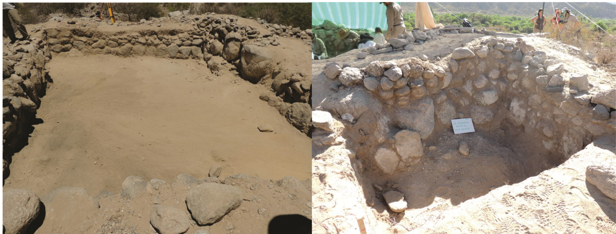
Figura 7. Izquierda, Recinto 13 al final de la excavación; derecha, Recinto 12 (Esquina NE).

Una vez finalizada la excavación del recinto 13 pudimos constatar que el mismo es una estructura rectangular continua sin ninguna abertura para su acceso. Para la construcción de las paredes, tanto en el recinto 13 como en el 12, se utilizaron cantos rodados de diferentes tamaños de acuerdo a los distintos sectores de la pared. Para la hilera inferior -a modo de cimientos- se utilizaron mayormente piedras con alturas entre 30 y 40 cm, y anchos generalmente menores; no obstante en ciertos sectores, también fueron dispuestas piedras aún mayores, con una altura equivalente a la de toda la pared (aproximadamente 60 cm). En las hileras superiores se colocaron rodados más pequeños, entre 10 y 25 cm. Las piedras se encuentran unidas con barro mezclado con piedras más pequeñas o pedregullo (Figura 7, izquierda).