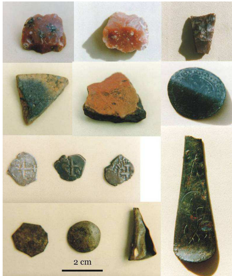
Figura 5. Materiales arqueológicos procedentes del saqueo del segundo asentamiento de la reducción “Nuestra Señora de la Concepción de los Indios Pampas”