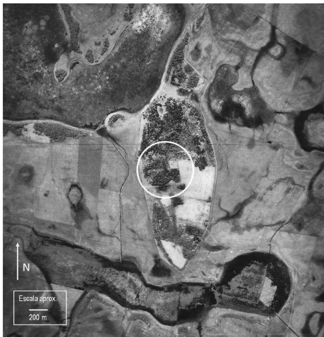
Figura 3. Detalle del Fotograma C 1189-50 (13-08-1984) del Ministerio de Obras Públicas, Provincia de Buenos Aires. El círculo indica el sector donde se localizan las ruinas del segundo asentamiento de la Reducción “Nuestra Señora de los Indios Pampas”.