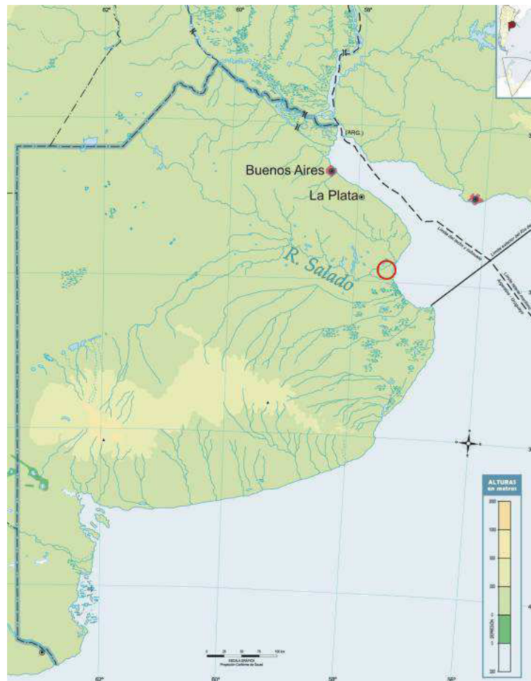
Figura 1. Localización de la reducción Nuestra Señora de la Purísima Concepción de los Indios Pampas (1740-1753).