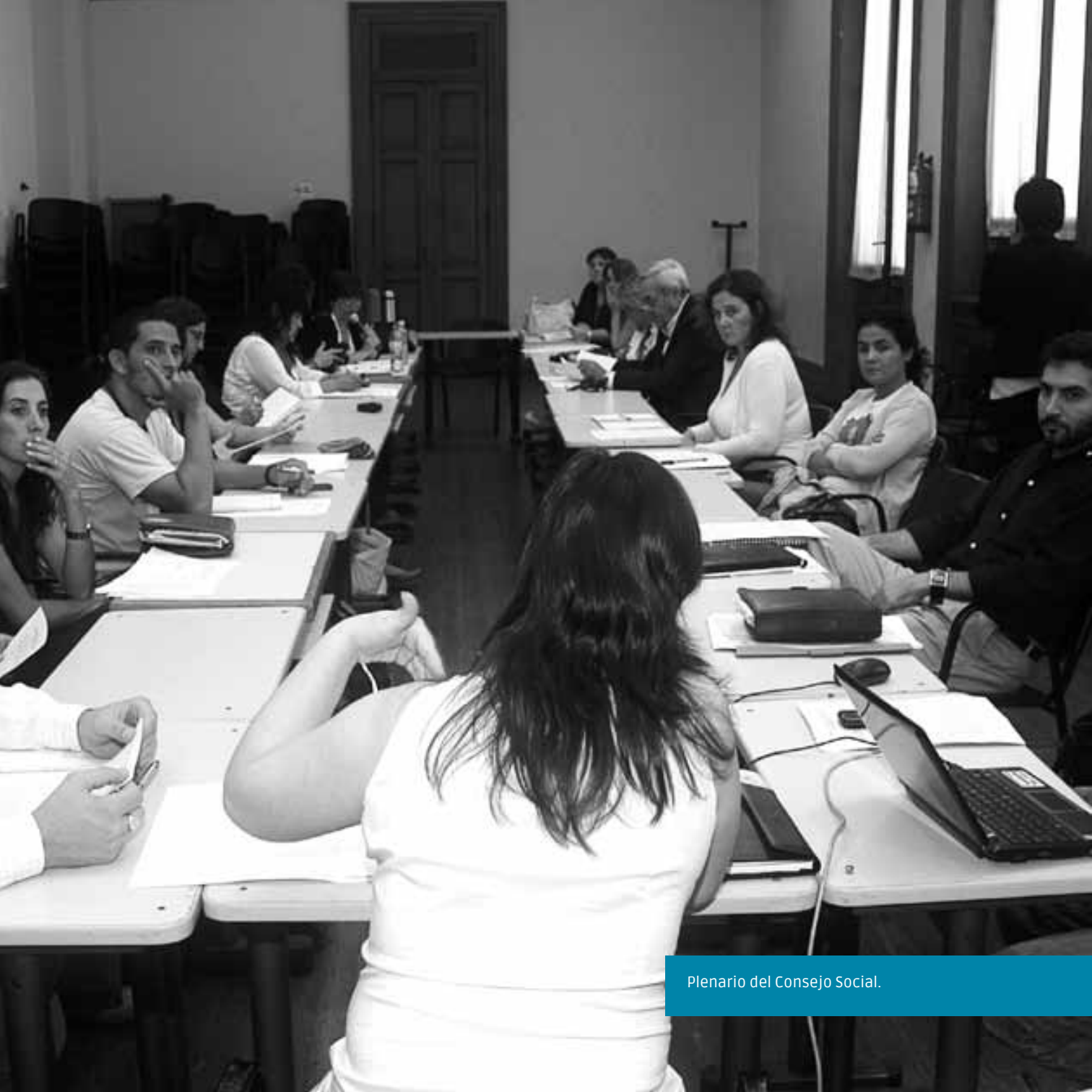
Plenario del Consejo Social.