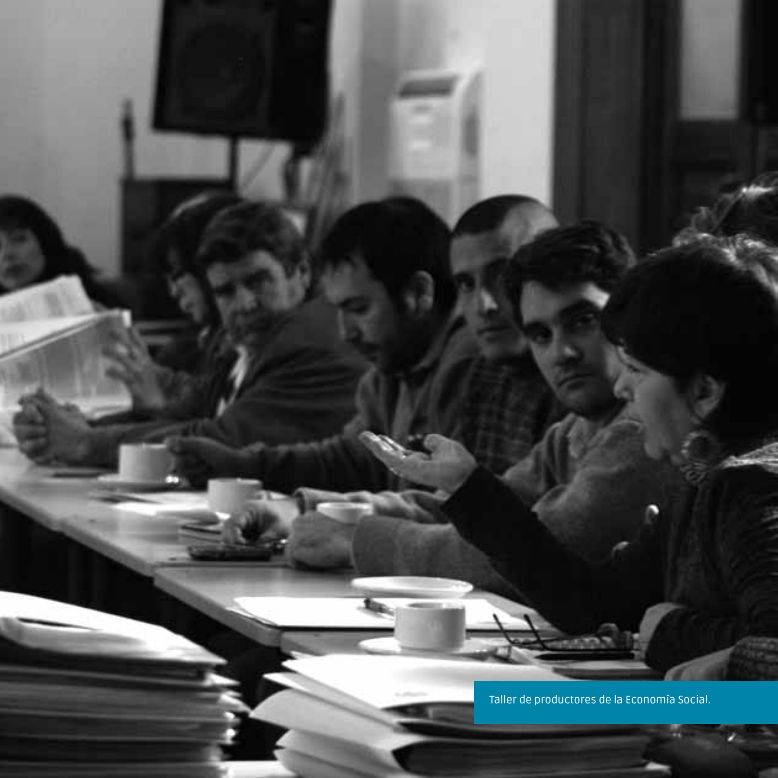
Taller de productores de la Economía Social.