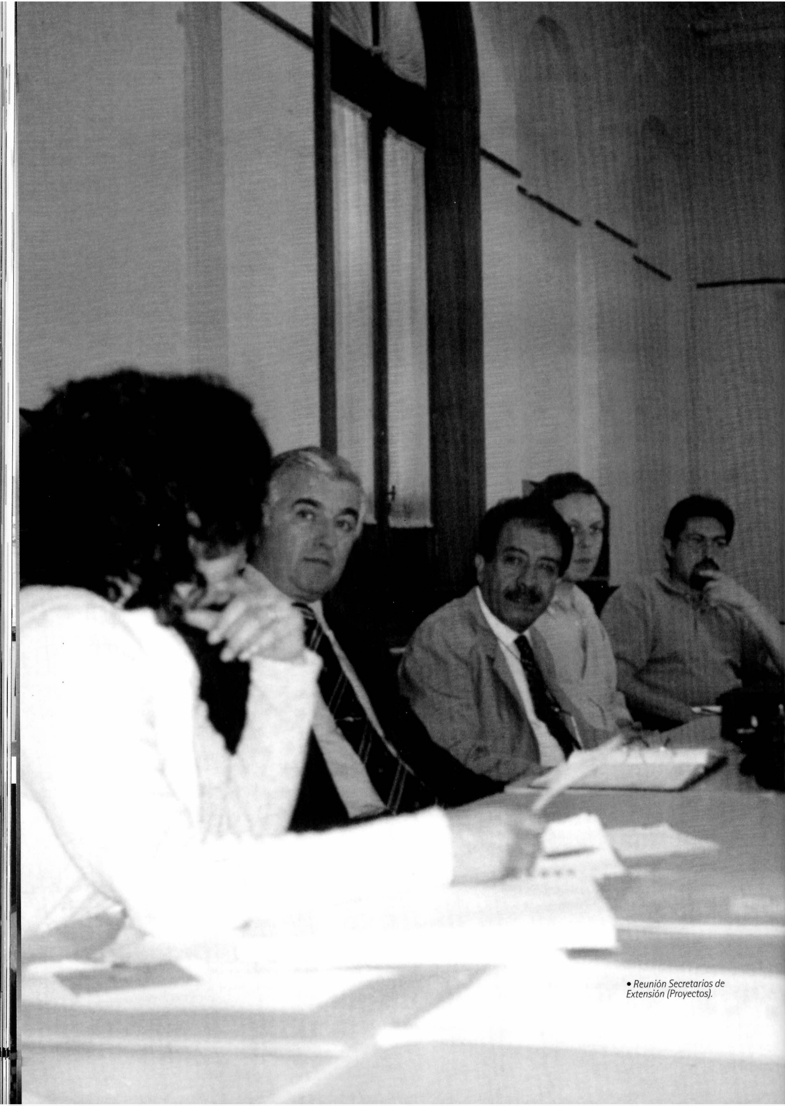
• Reunión Secretarios de Extensión (Proyectos).