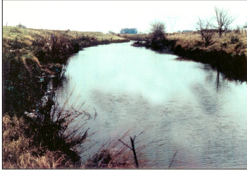
Figura 3. Río Matanza. Ruta 3.