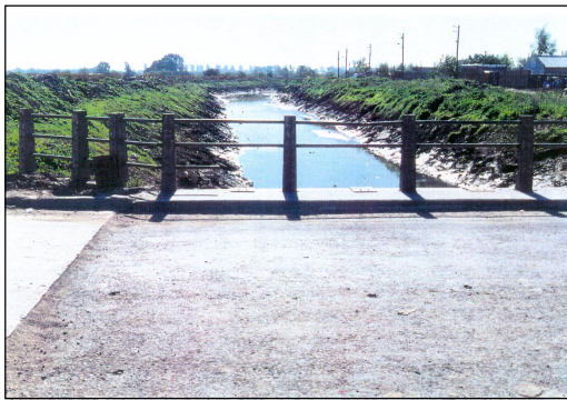
Figura 5. Arroyo Las Catalinas.