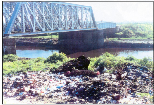
Figura 6. Río Matanza. Puente La Colorada.

mus sp. (Chironominae) Tanypus sp. y Coelotanypus sp. (Tanypodinae). La presencia de éstos comprende la cuenca alta y media del sistema, teniendo como límite máximo aguas arriba del arroyo El Rey; a partir de aquí y hasta la desembocadura no fueron registrados quironómidos en ninguna oportunidad. El género Chironomus sp. (Figura 2a) tiene una presencia casi constante, con una concentración bastante homogénea a lo largo de la cuenca alta y media, mostrándose como el más tolerante, teniendo su límite máximo a la altura de la desembocadura del arroyo Las Catalinas (Figura 5) en una zona de marcada reducción de organismos. El género Tanypus sp (Figura 2b) presenta altas concentraciones en determinadas estaciones de la cuenca alta y media del río, pero su presencia es menos constante tanto espacial como temporalmente, hallándose en una sola oportunidad a la altura del puente La Colorada (Figura 6), posiblemente de deriva de aguas arriba (no olvidemos el carácter de li-