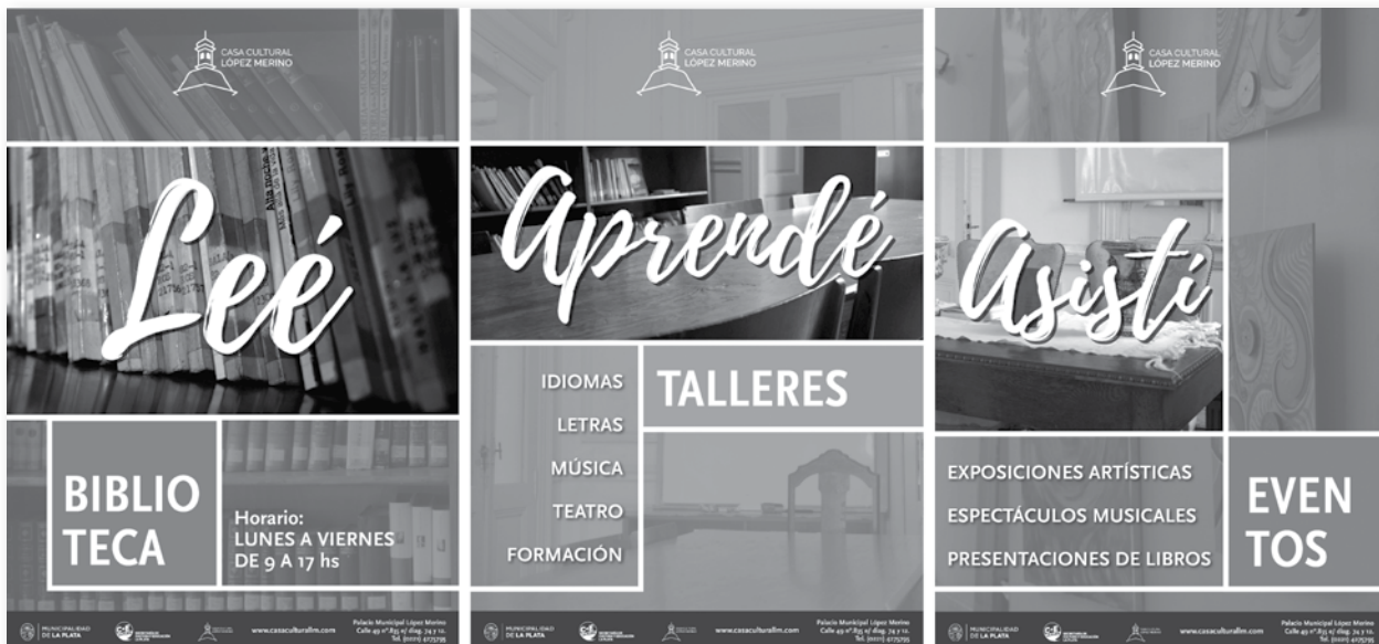
Figura 3 Sistema de afiches: Lee, Aprende, Asiste

Por otra parte, se diseñaron piezas de comunicación tradicionales, como un sistema de afiches para dar a conocer la institución y las actividades que propone, invitando al público a leer, aprender y asistir [Figura 3]. Los mismos están pensados para ser ubicados en la vía pública, en facultades y