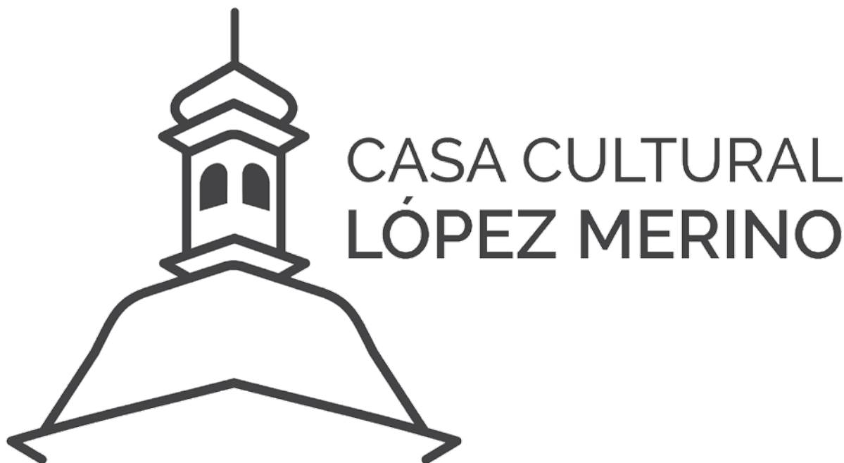
Figura 1 Marca de identidad

Para llevar a cabo este proyecto se tomó como comitente el Complejo Bibliotecario Municipal Francisco López Merino de la ciudad de La Plata, que funciona en el Palacio López Merino. Aquí conviven cuatro bibliotecas (Biblioteca Central, Biblioteca Almafuerce, Biblioteca María Elena Altube y Biblioteca de Autores y Temas Platenses), una hemeroteca y una videoteca. Además, allí se dictan diversos talleres y se llevan a cabo distintos eventos, como presentaciones de libros, exposiciones artísticas y espectáculos musicales.