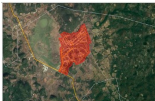
FIGURA 4A Tierras faltantes de titulación de propiedad social a Aguacatenango