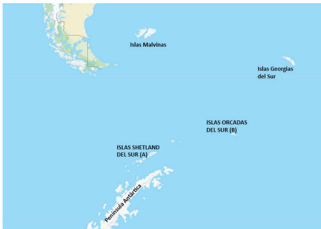
Figura 1. Localidades de procedencia de los cráneos analizados A. Islas Shetland del Sur (n=35) B. Islas Orcadas del Sur (n=43)

El estudio se basó en 78 cráneos de A. gazella , correspondientes a ejemplares machos adultos provenientes de Isla Laurie, Orcadas del Sur (n=43) e Islas 25 de Mayo, Nelson y Media Luna, Shetland del Sur (n=35). Los especímenes examinados pertenecen a las colecciones del Museo Argentino de Ciencias Naturales "Bernardino Rivadavia" (MACN-Ma), Museo de La Plata (MLP) e Instituto Antártico Argentino (IAA) (Apéndice 1).