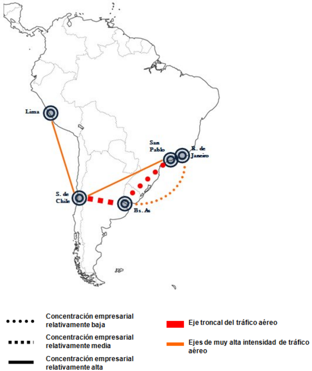
GRAFICO III: LAS 5 PRINCIPALES RUTAS EN TRÁFICO AEROCOMERCIAL DE AMÉRICA DEL SUR PARA 2011